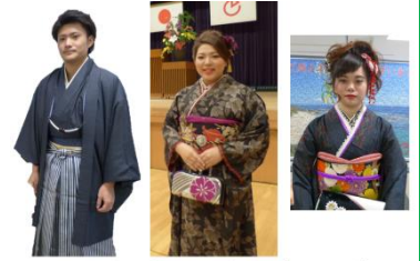
3名の新成人が大島紬着用