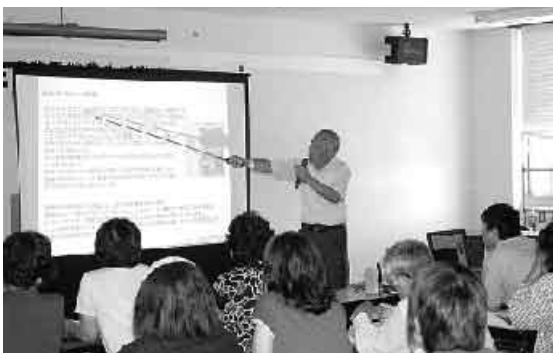
健康についてわかりやすく講演