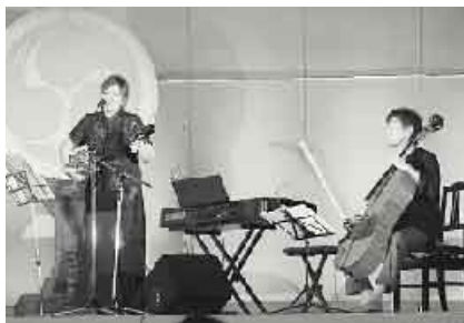
PTAサマーコンサート