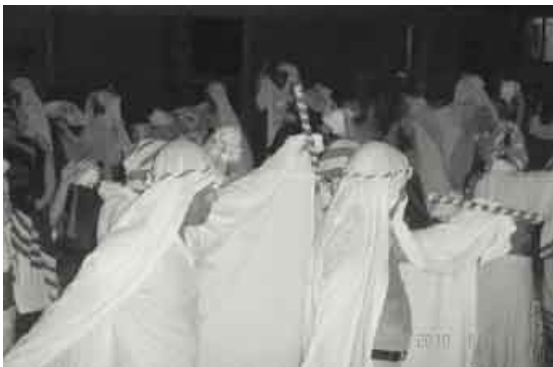
月明かりの下幻想的な踊りを披露

この「むちたぼり」は町の無形民俗文化財に指定され、豊作祈願の一種とされています。白い布を頭からかぶり扇子と棒を手にした男性陣と、浴衣姿の女性陣が、踊る様子が幻想的で、毎年島内外から多くの観光客が訪れています。