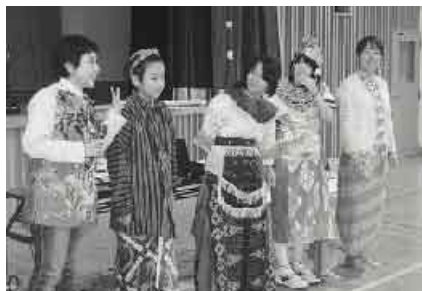
「協力隊OB・留学生が先生」

丁寧な文字でびっしりと書き込まれた生徒の感想文からは、心からの感動の様子がうかがえました。「百聞は一見に如かず」とよく言われますが、自分の耳で目で直接触れると、感動は一層強くなります。今後も、感動こそやる気の原動力ととらえて、本物との触れ合いを大切にしていきます