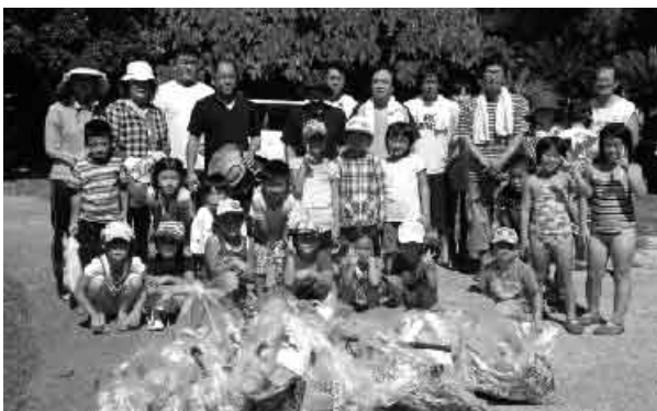
ボランティア清掃に参加された皆さん

清掃終了後には、海遊びやバーベキュー、音楽鑑賞で親睦を深め、夏の楽しい思い出作りをしたようです。ボランティア清掃に参加された皆さんお疲れ様でした。