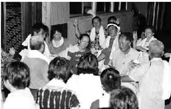
夜通し太鼓の音が鳴り響く

太鼓を持った人を中心に「あつたら7月」「てんだらこ」などを歌い踊り、各家々を回りました。朝まで太鼓の音が鳴り響き、井之川集落は帰省客や観光客で大賑わいでした。