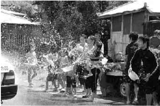
無病息災を祈り水を掛け合う

この「ネンケ」は、本来は農耕儀礼や若い男女の意思表示に利用されたとされていますが、現在は水を掛け合うことで厄を払い、無病息災を祈る意味合いが強いです。