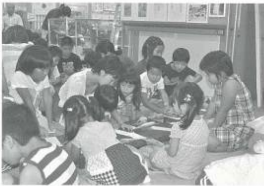
参加者みんなで七夕飾り作り

続いて、たなばたかざり作りがあり、折り紙や新聞紙を使って色とりどりの飾りや短冊を作っていました。作った飾りは笹に飾りつけし、図書館に飾られました。