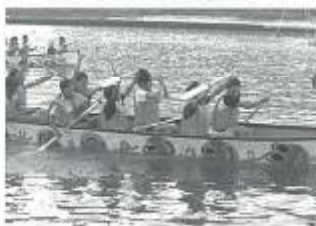
舟こぎ大会へ参加