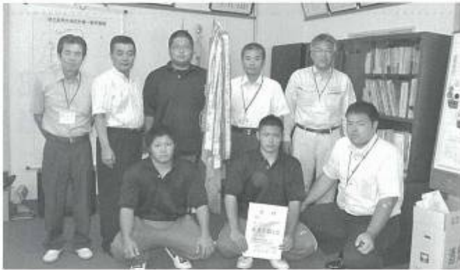
テニス団体（写真上）相撲高校団体（写真下）のみなさん。優勝おめでとうございます。