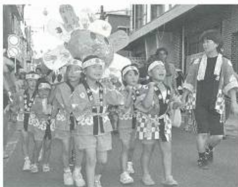
おみこし担いでワッショイ

保育園児、幼稚園児たちが作った提灯の灯りの下、様々な屋台等が並び、家族連れなどでにぎわう中央通りに活気がみなぎっていました。