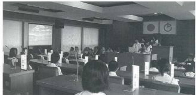
どの学校も立派な発表でした

今回の子ども議会で、子どもたちは、すばらしい経験ができたことと思います。子ども議会の準備をしていただいた先生方をはじめ、町長部局、町議会、各課長の御協力で無事実施することができました。この場を借りてお礼申し上げます。ありがとうございました