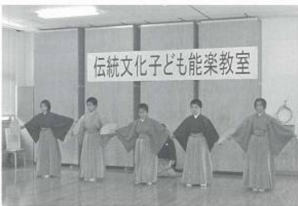
堂々とした態度で披露