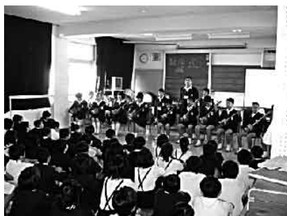
対面式の様子 島唄と三味線の演奏)