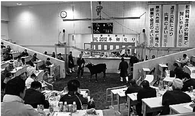
セリ市は活気がみなぎっていました

今年初めてとなったセリ市では、2日間合計で雌264頭、去勢326頭、計590頭が売却されました。雌の平均価格は、33万4826円、去勢の平均価格は41万2746円となりました。 2日間の合計590頭の平均価格は37万7880円で、前回より2万4741円、前年比で3万4325円アップとなりました。