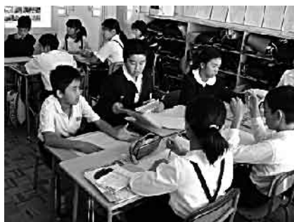
清水小での合同授業の様子