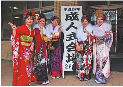
晴れ着姿で記念撮影