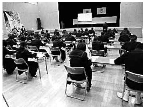
真剣に問題に取り組む3年生