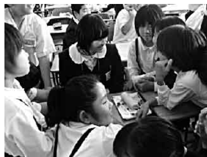
休み時間での交流の様子