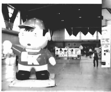
国保の“健康ぼうや”が みなさんをお出迎え……

“食・農・健やか”をテーマに「第17回健康まつり」と「第37回農業祭」が11月20日（土）に開催されました。今回はその様子をお伝えします。今年参加できなかったかた、来年はぜひお越しください！！