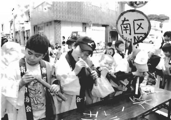
早くむけるかな「ウギむぎ競争」

飲酒運転根絶キャンペーン 11月2日から12月18日にかけて、飲酒運転撲滅街頭キャンペーンが12月10日、Aコープ徳之島店前で行われました。 年末年始をひかえ、お酒を飲む機会がふえるこの時期に毎年行われているキャンペーンには、町交通安全母の会の会員をはじめ、徳之島警察署員、役場総務課の職員らが、のぼり旗やチラシを手に持ち、「飲酒運転の根絶にご協力ください」と買い物客などに声をかけました。 飲酒運転は重大な犯罪です。飲酒運転を絶対に「しない!」「させない!」という強い意志を持ち、みんなで協力し合って飲酒運転の根絶を目指しましょう。