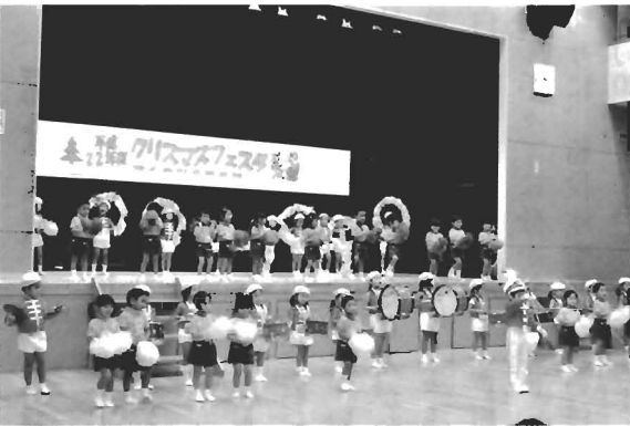
亀徳保育園児によるマーチング

最後には、プレゼント抽選会があり、集まった子供たちはくじを片手に一喜一憂していました。