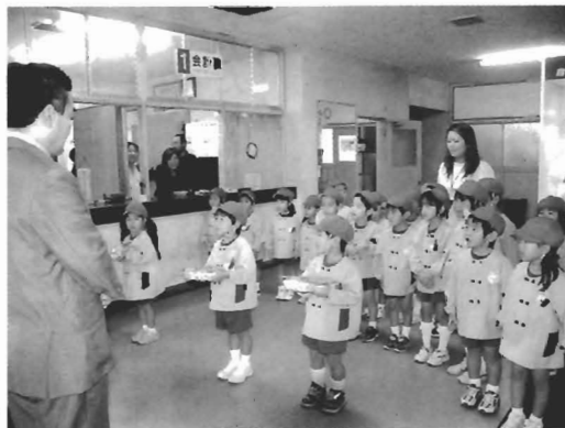
亀津保育園（写真左）と亀徳保育園（写真右）の皆さん