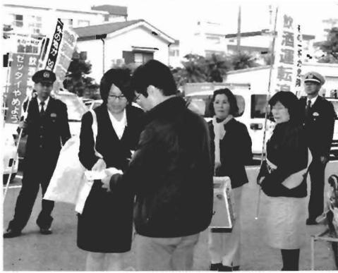
チラシで飲酒運転根絶を訴える

飲酒運転根絶キャンペーン 11月2日から12月18日にかけて、飲酒運転撲滅街頭キャンペーンが12月10日、Aコープ徳之島店前で行われました。 年末年始をひかえ、お酒を飲む機会がふえるこの時期に毎年行われているキャンペーンには、町交通安全母の会の会員をはじめ、徳之島警察署員、役場総務課の職員らが、のぼり旗やチラシを手に持ち、「飲酒運転の根絶にご協力ください」と買い物客などに声をかけました。 飲酒運転は重大な犯罪です。飲酒運転を絶対に「しない!」「させない!」という強い意志を持ち、みんなで協力し合って飲酒運転の根絶を目指しましょう。