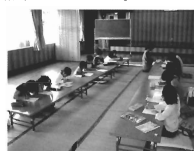
花徳教室では、小さい子どもが多く頑張っています

花徳教室は、低学年の子も多いのですが、みんなしっかり勉強できていました。宿題が、早く終わった子どもも読書するなどして3時間がんばっています。