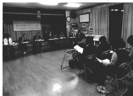
子どもの在り方について活発な意見が出されました

このような地域からの意見をもとに、地域と学校、行政が連携を深め、教育行政を充実させていきます。また、今後も移動教育委員会を計画していきます。