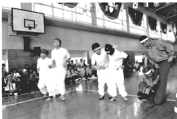
うまくはけるかな「お母さんと仲良く」

町社会福祉協議会が主催して開催された大会は、町民生委員児童委員協議会員、町身体障がい者福祉協会員など約400人が参加。地区対抗で紅組（尾母・亀津）・白組（亀徳・下久志）・黄組（母間・手々）に分かれ、50m走を皮切りに、輪投げやパン食い競争など約20種目で熱戦を展開しました。今年は、前回に引き続き白組が優勝し、以下、紅組、黄組という結果になりました。