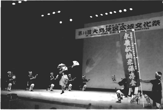
和泊町による「永嶺収納米」

また、文化祭では、大島郡内の市町村による伝統芸能や島唄、創作舞踊の舞台発表や絵画や書道、手工芸の展示などで交流を深めました。