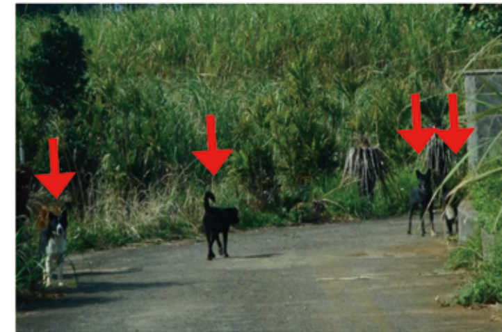
集落付近で群れている状況

徳之島町、天城町、伊仙町、環境省徳之島管理官事務所、鹿児島県(徳之島保健所、生活衛生課、自然保護課)