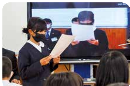
【カメラで発表者を映し、3校児童で互いの意見を発表】