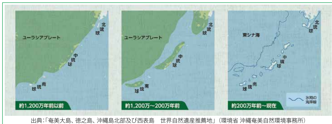
出典:「奄美大島、徳之島、沖縄島北部及び西表島 世界自然遺産推薦地」(環境省 沖縄奄美自然環境事務所)

その5 徳之島を含む中琉球や南琉球の島々は昔、ユーラシア大陸の一部でした。それが長い年月をかけ、地面が動き海面の高さが変わり、今の島々の形になります。大陸と切り離された豊かな自然のある島の中で、生き物達は生き残り、またそれぞれが進化して、その地域だけにしかない生き物である固有種となっていました。