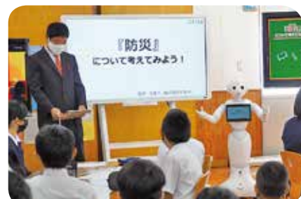
【人型ロボット「Pepper」が津波について分かりやすく解説】