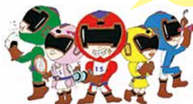
【歯っぴいレンジャー】

80歳以上の方で、自分の歯を20本以上保持している方を対象に、毎年鹿児島県歯科医師会、大島郡歯科医師会、徳之島町より表彰を行っています。例年各地区の敬老会等で、表彰伝達が行われていましたが、今年はコロナウィルス感染症予防対策の一環で敬老会等が中止になり自宅へ伺っての表彰伝達となりました。今年度は17名の方が受賞されました。