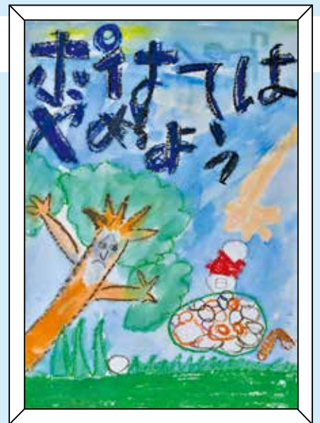
※令和元年時点の学年です。