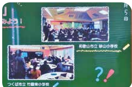
【和歌山市立砂山小の6年1・2組70名とつくば市立竹園東小5年2組32名と合同授業】