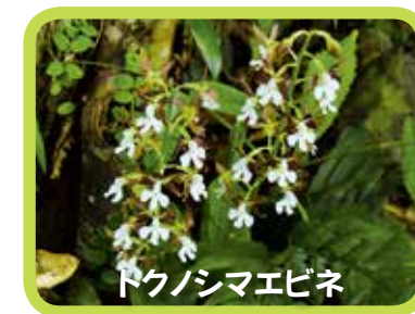
トクノシマエビネ

このように、4地域には絶滅のおそれのある生き物や世界でもこの地域でしかみられない生き物の宝庫であり、将来の世代に引き継ぐべき人類共通の財産として登録を目指しています。