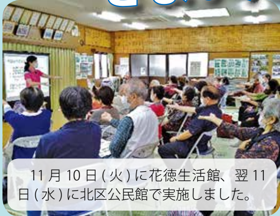
11月10日(火)に花徳生活館、翌11日(水)に北区公民館で実施しました。

県民総合保健センターより2名の講師をお招きして、膝・腰・肩の「楽しく教室」を実施しました。