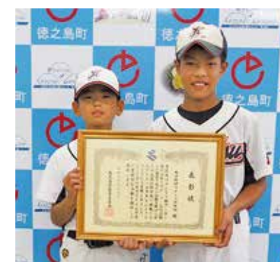
亀津野球スポーツ少年団