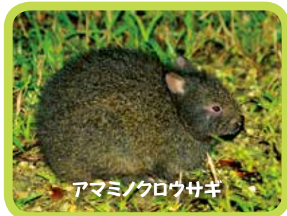
アマミノクロウサギ

4地域でみると、維管束植物は188種が、昆虫類は1,607種が固有種です。また、4地域にいる陸生哺乳類の固有種率が62%（21種のうち13種が固有種）といったように、陸生爬虫類では64%、両生類は86%、陸水性水産類は100%など、4地域に生息する動植物は極めて高い固有種率となっています。