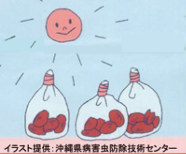
イラスト提供: 沖縄県病害虫防除技術センター