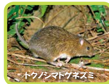
トクノシマトゲネズミ

奄美大島、徳之島、沖縄島北部及び西表島の4つの地域には、照葉樹林やマングローブ林などの豊かな自然の中に、たくさんの絶滅危惧種や固有種が生息しています。IUCN(国際自然保護連合)の絶滅危惧種リストである「レッドリスト」には、4地域の95種の生き物が絶滅危惧種として掲載されています。また日本全国で確認されている絶滅危惧種のうち、この4地域で見られる種の割合は、維管束植物が55%、陸生哺乳類が38%、