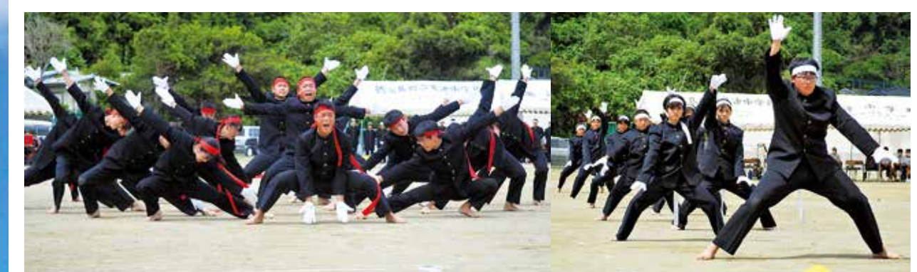
声を枯らし全力で取り組んだ亀津中応援団