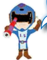
【ケンちゃんジャー】

歯と口を健康に保つためには、歯みがきなどのセルフケアに加えて、 歯科で行う専門的なケアが重要 です。自分にあった「 かかりつけの歯医者さん 」を見つけて、歯と心身の健康を保ちましょう。