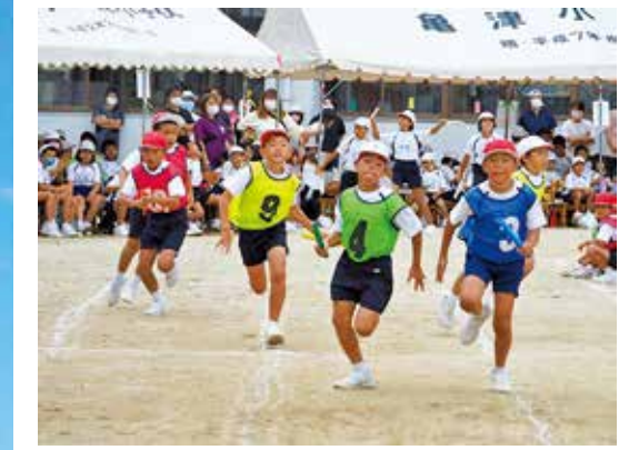
感染対策を強化し無事開催された亀津小運動会

9月中旬から下旬にかけて、町内の小中学校で運動会・体育大会が開催されました。今年は新型コロナウイルス感染症対策のため各校とも規模を縮小し開催。亀津中学校は12日・13日の2日間にかけて、それぞれ午前中に体育大会を実施しました。13日は天候の変化が激しく一部が体育館での実施となったものの、リレーや応援団の演舞に大きな声援が送られ熱気ある体育祭となりました。 また9月25日に天城町で島内初の新型コロナウイルス感染者が確認され、翌々日の亀津小・亀徳小の運動会開催が懸念されましたが、感染対策をより強化し実施。児童は元気いっぱい競技に組みました。