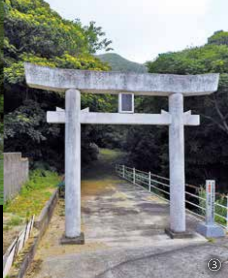
【掟大八も祀られている手々豊穀神社の鳥居と祠。】