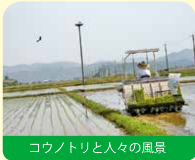
コウノトリと人々の風景

しかし、コウノトリが大空を舞う姿を見ようと地域に観光客が訪れ始めたこと、コウノトリも育つ安心・安全な環境で生産された農作物を食べてみたいとの需要の高まりにより、観光産業の発展や農作物の消費拡大など地域経済全体の活性化が進み、今では地域の方々の理解の下、水田を歩くコウノトリの姿は豊岡市の日常の風景になっています。