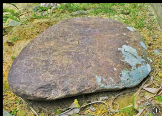
【掟大八が力試しに使った「力石」。】