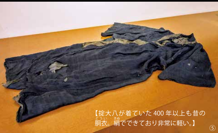
【掟大八が着ていた400年以上も昔の胴衣。絹できており非常に軽い。】