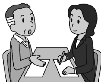
消費者庁イラスト集より