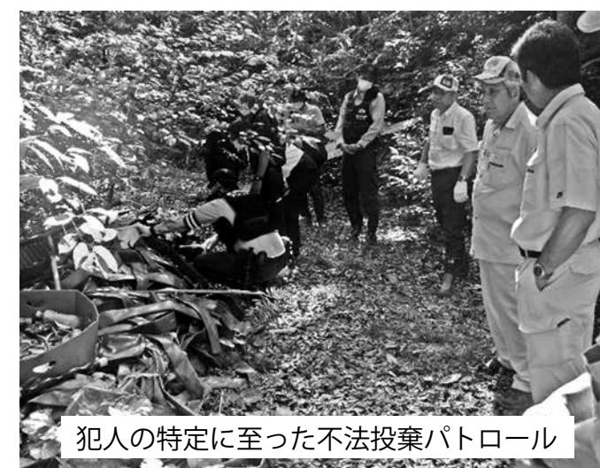
犯人の特定に至った不法投棄パトロール