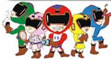
【歯っぴりレンジャー】

いつまでもおいしく食事をするためには、毎日のお手入れで健康な歯を保つことが重要です。生涯、自分の歯で楽しんで食べられるように、80歳までに20本以上の歯を保つ「8020」達成を目指しましょう。