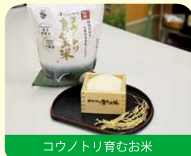
コウノトリ育むお米

長崎県の対馬ではツシマヤマネコに配慮した農法で生産されたお米が“佐護ツシマヤマネコ米”として生産・販売されるなど、野生動物との共存を目指した農業は、地域の新たな資源、そして日本が世界に誇る資源として脚光を浴びています。