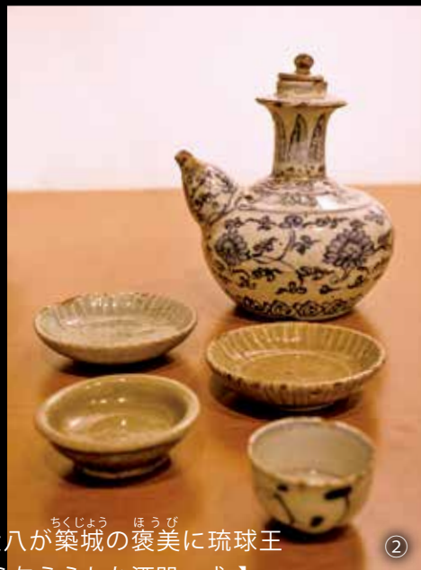
【大八が築城の褒美に琉球王から与えられた酒器一式。】