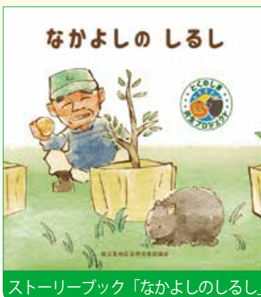
ストーリーブック「なかよしのしるし」

その先駆けとして、先月号までにお知らせしたタンカン農家さんとアマミノクロウサギとの間で発生した問題、そして食害対策を通じて手を取り合うまでの内容を描いたストーリーブックを制作しました。また、タンカン梱包箱のデザインを一新し、農園で育つアマミノクロウサギの親子の姿