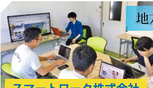
スマートワーク株式会社

ホームページ作成ツール「Wix」や360°画像を制作する「スマートパノラマ」など、デジタルワークを徳之島のクリエイターが手がける「クリエイティブファクトリー」の構築を推進。