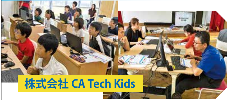
株式会社 CA Tech Kids

2020年度から日本でも初等教育でプログラミング教育が必修化されるにあたり、総務省のモデル事業を活用したメンター（指導者）の育成や、児童・生徒へのプログラミング授業を本町で実施。