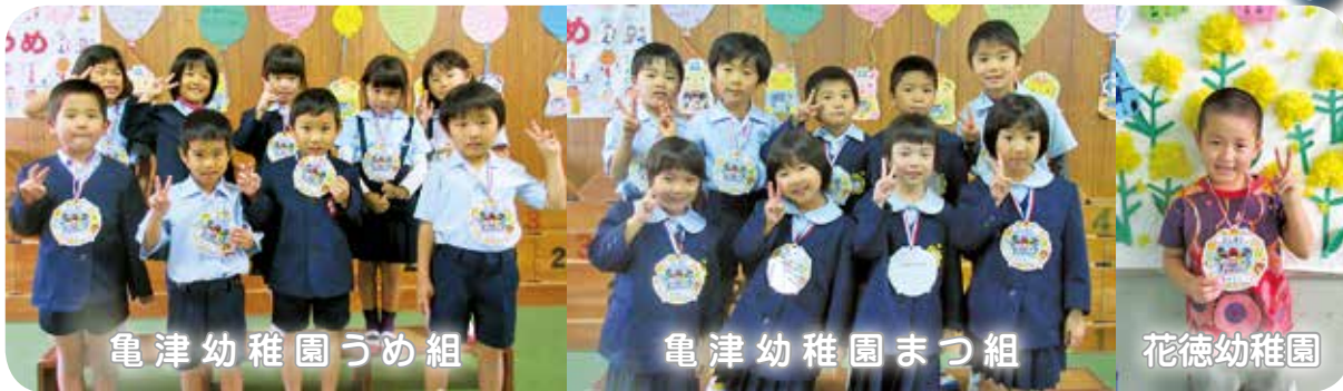
亀津幼稚園うめ組