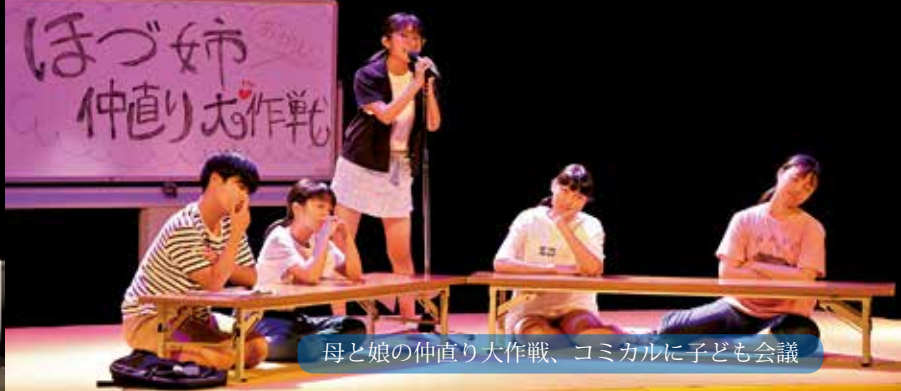
母と娘の仲直り大作戦、コミカルに子ども会議