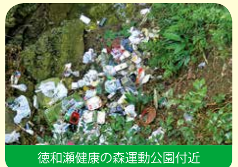
徳和瀬健康の森運動公園付近

不法投棄は、景観を損なうだけでなく、有害な物質が漏れることで環境汚染につながる 重大な犯罪 です。一度環境が汚染されると、その周辺に棲む生き物達の環境は大きく変わり生態系に悪影響を与えます。不法投棄が判明した場合、投棄物の撤去・適切な処理が命じられるだけでなく、悪質な場合は警察に摘発され、「廃棄物の処理及び清掃に関する法律」により、罰則（5年以下の懲役若しくは1000万円以下（法人の場合は3億円以下）の罰則に処し、又はこれらの併科）を受けることとなります。不法投棄を発見したら、速やかに最寄りの警察署か住民生活課へ連絡してください。