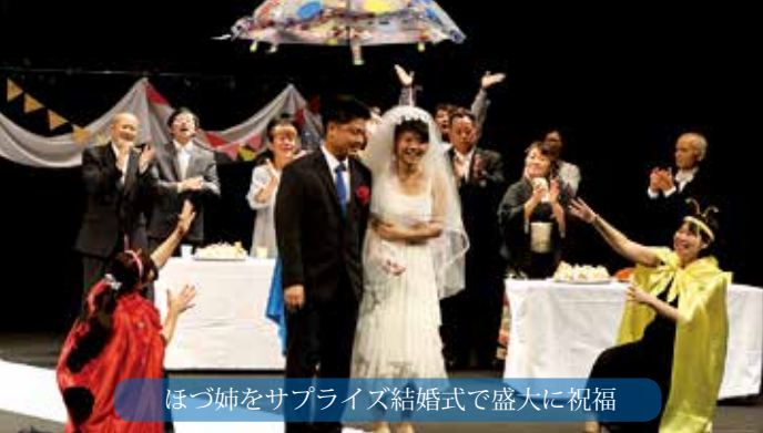
ほづ姉をサプライズ結婚式で盛大に祝福