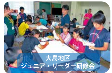
大島地区 ジュニア・リーダー研修会

【7/26～7/28 奄美市 3名参加（尾母中2年・亀津中1年・井之川中1年）】