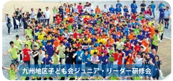
九州地区子ども会ジュニア・リーダー研修会