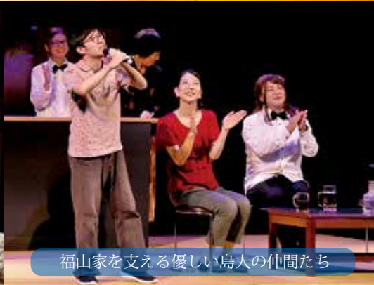
福山家を支える優しい島人の仲間たち

島の思いが伝わりました。また、島民が演じる事に意味があります。島の子も達が島に帰り、また島で生きて欲しい。