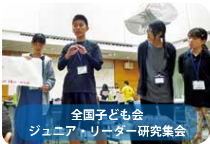
全国子ども会 ジュニア・リーダー研究集会