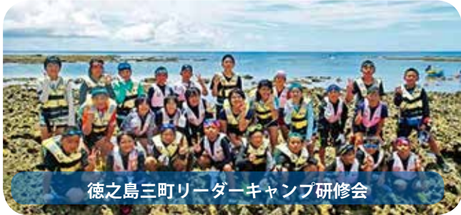
徳之島三町リーダーキャンプ研修会

それぞれに様々な気づきを得た子ども達。今回の学びを活かし、子ども会等の地域活動を行っていきます。