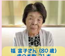
福 富子さん (80歳) 歯の本数 21本