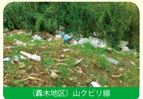
（轟木地区）山クビリ線