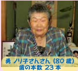
勇 ハリ子さん (80歳) 歯の本数 23本