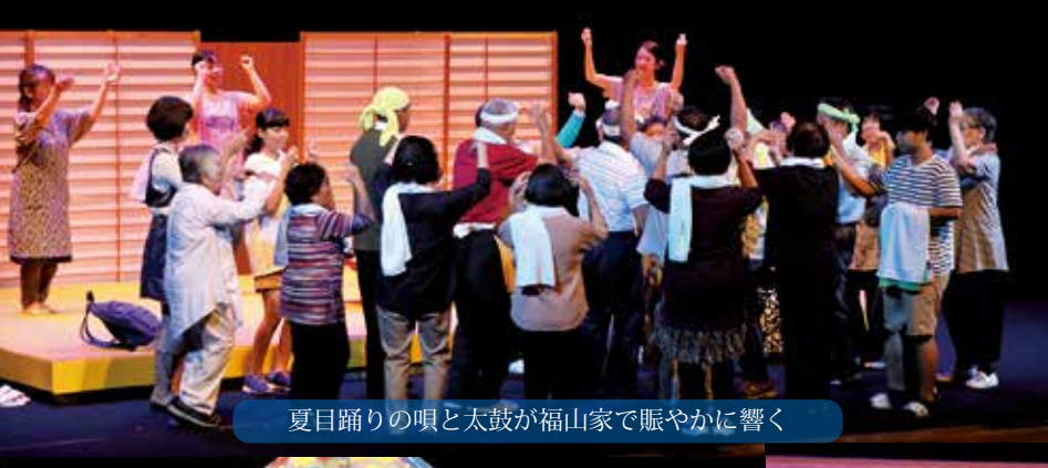
夏目踊りの唄と太鼓が福山家で賑やかに響く