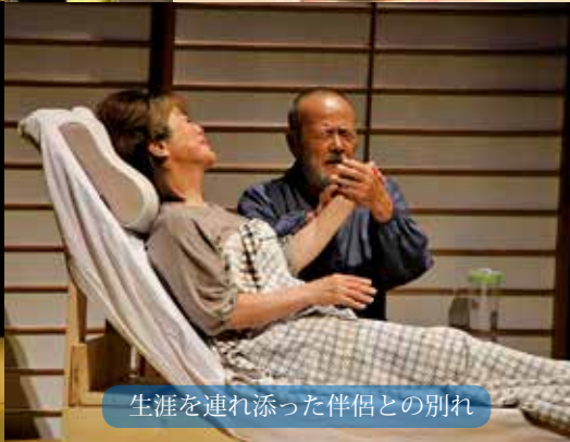
生涯を連れ添った伴侶との別れ