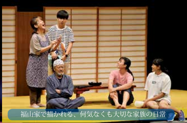
福山家で描かれる、何気なくも大切な家族の日常