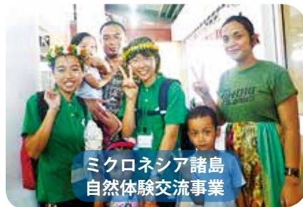
ミクロネシア諸島 自然体験交流事業