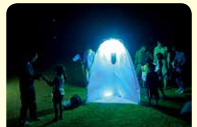
習性を利用した昆虫灯火採集

【※本事業は、徳之島の自然環境保全を目的に全国の皆様から寄せられたふるさと納税を活用しています。】