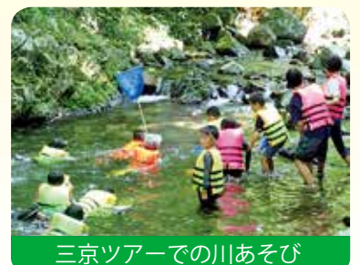
三京ツアーでの川あそび