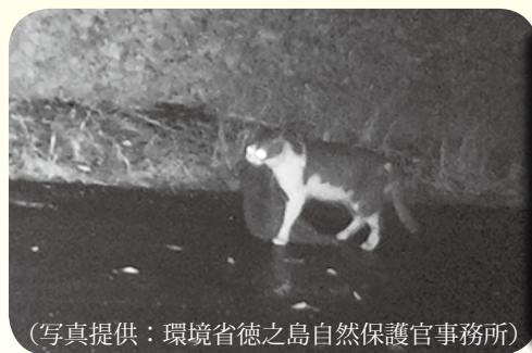
クロウサギを 捕食するネコ

この他、依然として地域住民によるゴミのポイ捨ても後を絶ちません。中でも弁当や残飯等の食べ残しゴミは、ネコの山への侵入や繁殖を助長する可能性があります。この地域にしか生息していない貴重な生きもの達を後世に繋ぎ伝えるため、皆様のご理解とご協力をお願いします。