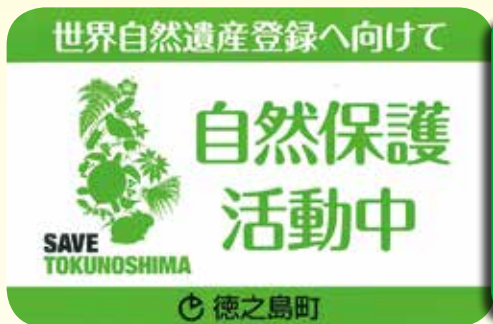
パトロール車の マグネットシート

しかし、これらの取組みだけでは十分とは言えず、地域全体でペットの適正な飼育に取り組む必要があります。昨年1月徳之島町北部の道路上で、ネコがアマミノクロウサギをくわえ歩く写真をご覧になった方もいるのではないのでしょうか。徳之島では、放し飼いの野良猫が山へ侵入し自ら餌を探し求めた結果、希少な動物を捕食してしまう悲しい事故が起きています。