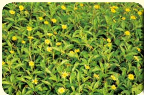
外来種の アメリカハマグルマ

しかし、これらの取組みだけでは十分とは言えず、地域全体でペットの適正な飼育に取り組む必要があります。昨年1月徳之島町北部の道路上で、ネコがアマミノクロウサギをくわえ歩く写真をご覧になった方もいるのではないのでしょうか。徳之島では、放し飼いの野良猫が山へ侵入し自ら餌を探し求めた結果、希少な動物を捕食してしまう悲しい事故が起きています。