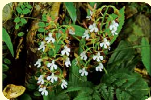
徳之島山中で咲いた トクノシマエビネ

「奄美大島、徳之島、沖縄島北部及び西表島」の世界自然登録にあたっては、希少な動植物を将来にわたり保護する取組みが極めて重要です。徳之島町では、その取組みとして在来植物の生息を脅かす外来植物「アメリカハマグルマ」の抜き取り作業や希少動物との交通事故を防ぐことを目的とした車両減速帯の設置を行っています。また、希少動植物の盗採・盗掘を未然に防止するため、昼夜を問わず徳之島3町希少野生動植物保護推進員と連携したパトロール活動等も実施しています。