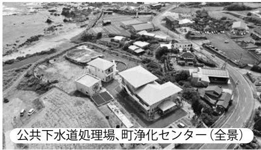
公共下水道処理場、町浄化センター(全景)

問 公共下水道の町浄化センターの業務内容、運営状況、汚泥処理、水質検査の結果、また今後の公共下水道整備計画を問う。