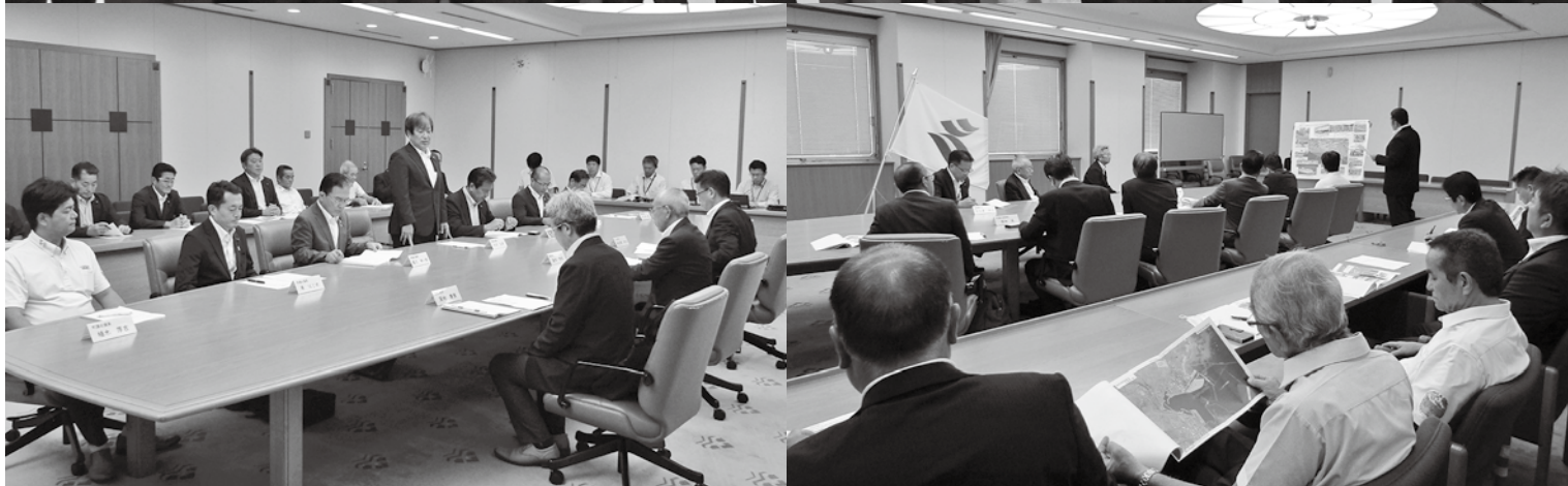
亀徳港の整備に関する県への要望活動（令和6年8月1日）