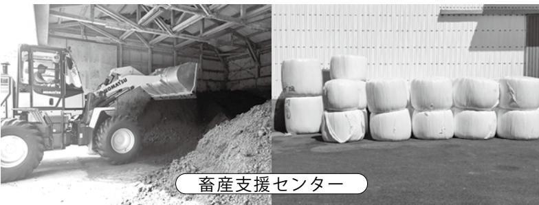
畜産支援センター