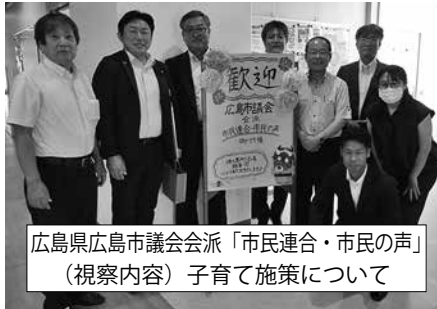
広島県広島市議会会派「市民連合・市民の声」 (視察内容) 子育て施策について