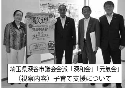
埼玉県深谷市議会会派「深和会」「元氣会」 (視察内容) 子育て支援について