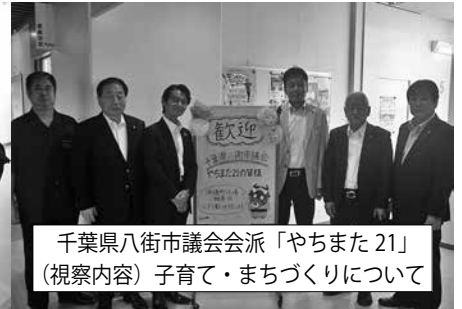
千葉県八街市議会会派「やちまた21」 (視察内容) 子育て・まちづくりについて