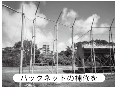
バックネットの補修を

徳和瀬プール横の多目的広場は、スポーツ少年団など多くの子供たちが利用している。バックネットの金具が腐食しグラインド内に散乱して非常に危険である。早急に撤去、応急処置できないか。