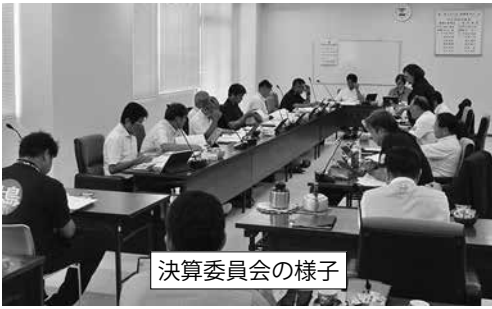
決算委員会の様子