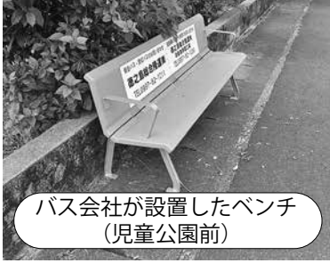
バス会社が設置したベンチ (児童公園前)