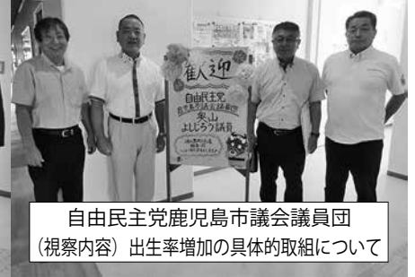
自由民主党鹿児島市議会議員団 (視察内容) 出生率増加の具体的取組について