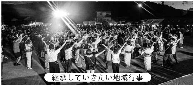
継承していきたい地域行事

は、平成13年度母間港建設当時、用地交渉の結果、幅員4.8mとなっている。今後、イベント状況や地域の意向も踏まえ、道路を2.5m拡幅する為用地交渉を検討する。