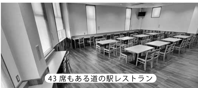
43席もある道の駅レストラン