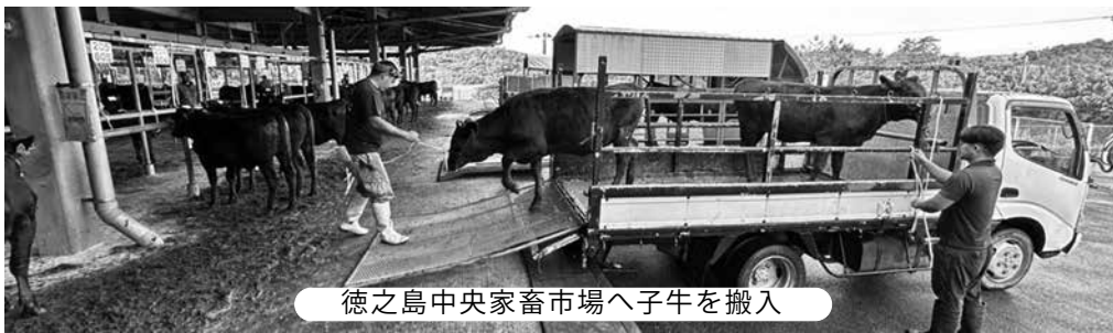
徳之島中央家畜市場へ子牛を搬入

肉用牛ヘルパー組合によって実施されており、町内の肉用牛飼育農家で構成されているため、組合により畜産農家へは周知を強化している。