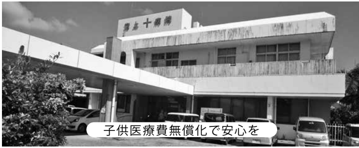
子供医療費無償化で安心を