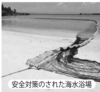
安全対策のされた海水浴場

るよう、安全利用啓発文や緊急連絡先、AED設置場所などを示した看板の設置、また、海岸清掃機材の導入や、ビーチフェンスの設置ができないか。