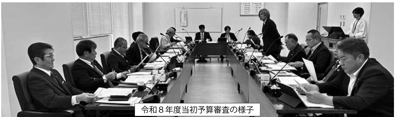
令和8年度当初予算審査の様子