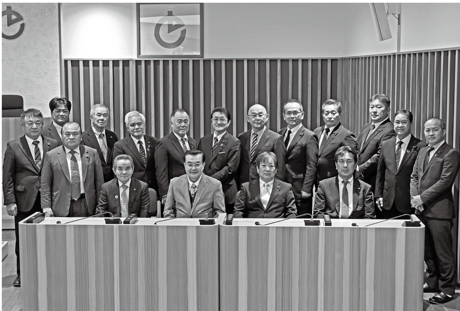
4年間お世話になりました【最終議会】

発行：徳之島町議会 編集：議会広報編集委員会 〒891-7192 鹿児島県大島郡徳之島町亀津 7203 TEL 0997 (82) 1130 FAX 0997 (82) 1101