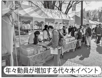
年々動員が増加する代々木イベント

答 徳之島物産フェアは集客も増加傾向、その中には移住、ふるさと納税の相談件数も増加している。商談会においては特産品や加工品について問い合わせも増加していることから、イベントを継続して魅力発信につなげる。