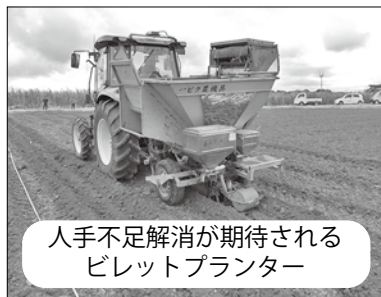
人手不足解消が期待される ビレットプランター