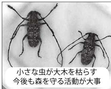
小さな虫が大木を枯らす 今後も森を守る活動が大事

3月定例会には、11人の議員が登壇し、農業振興、県道・町道・通学路に関すること、カスハラ対策、福祉政策、北部地区への人流についてなど町政全般にわたり執行部の考えをたえました。質問と答弁の要旨は次のとおりです。