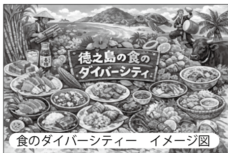
食のダイバーシティ イメージ図

※「多様性」を意味し、年齢・性別・国籍・障害の有無・性的指向等、様々な背景や特性を持つ人々が組織や社会で共存し、互いを尊重しながら個々の能力を最大限に発揮する。