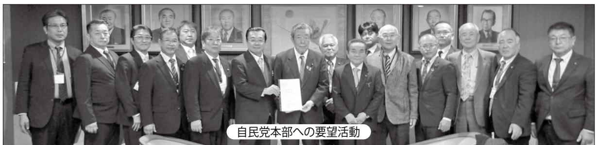
自民党本部への要望活動