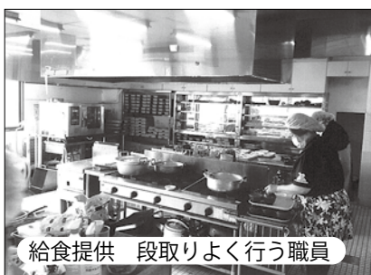
給食提供 段取りよく行う職員