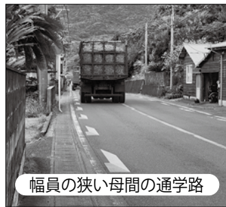
幅員の狭い母間の通学路

員が狭く、子ども達や高齢者の安全確保がされていない。特に、製糖期間は大型のキビ輸送トラックが頻繁に走行するが、改善できる方策はないか。