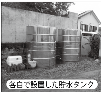
各自で設置した貯水タンク