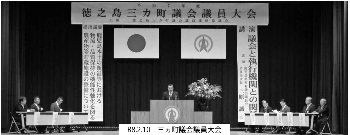
R8.2.10 三カ町議会議員大会