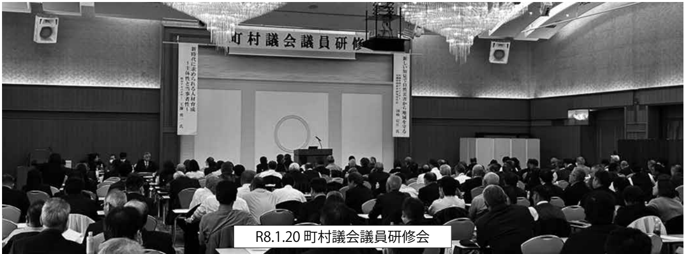
R8.1.20 町村議会議員研修会