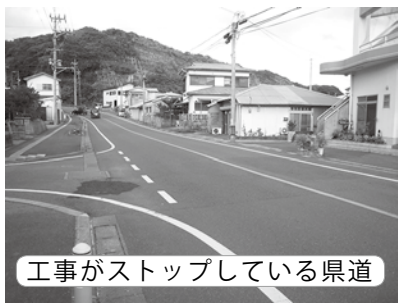
工事がストップしている県道

は、国・県が示すべきだと考える。持続可能な医療制度を構築するためには、国・県との連携が必要不可欠。また、無料化については、国・県に対して、しっかりと要望していきたい。