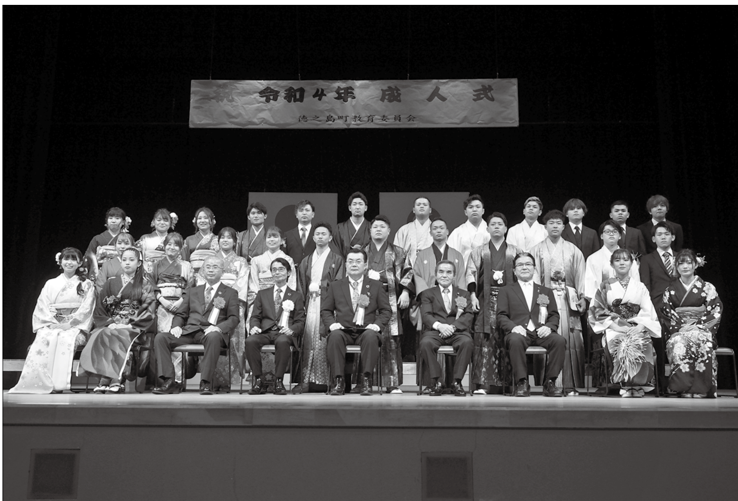
令和4年成人式での集合写真（南区）

発行：徳之島町議会 編集：議会広報編集委員会 〒891-7192 鹿児島県大島郡徳之島町亀津 7203 TEL 0997 (82) 11111 FAX 0997 (82) 1101