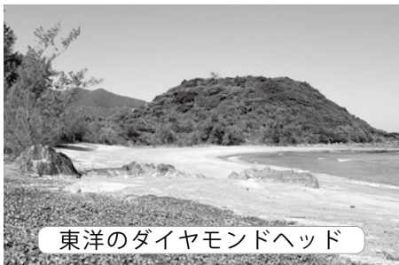
東洋のダイヤモンドヘッド