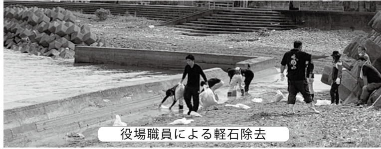
役場職員による軽石除去

10月29日に県知事を議長とする軽石漂着等対策調整会議にて、国県市町村においてそれぞれ今後の対策等について協議を行って対応した。長期的な対策も必要であることから今後、建設業協会等の協力も得ながら除去・回収を行なっていく。