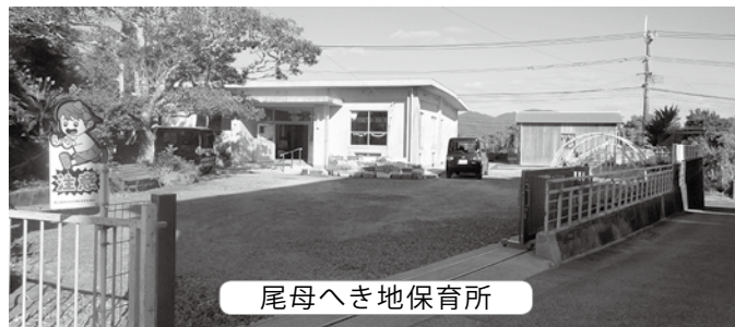
尾母へき地保育所

12月定例会には、10人の議員が登場し、幼児教育、子育て支援、学校振興、世界自然遺産及び観光振興、コロナウイルス対策、農業振興など町政全般にわたり執行部の考えをたどりました。質問と答弁の要旨は次のとおりです。