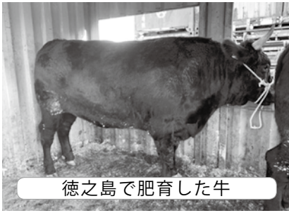
徳之島で肥育した牛

問 ふるさと納税の返礼品としても人気のある和牛。我が町で進める肥育牛の現況と、今後の課題は。