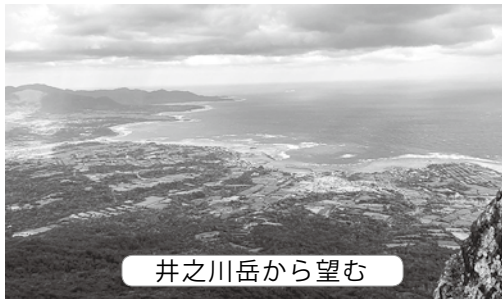
井之川岳から望む