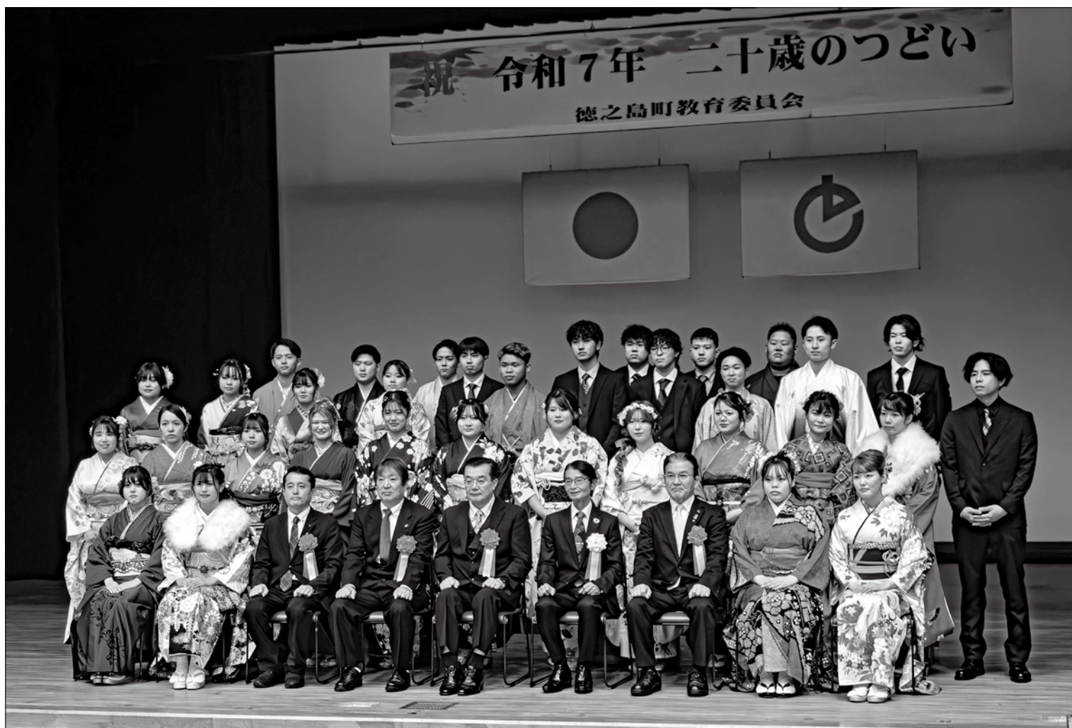
令和7年二十歳のつどい（北区・中区）

発行：徳之島町議会 編集：議会広報編集委員会 〒891-7192 鹿児島県大島郡徳之島町亀津 7203 TEL 0997 (82) 1130 FAX 0997 (82) 1101