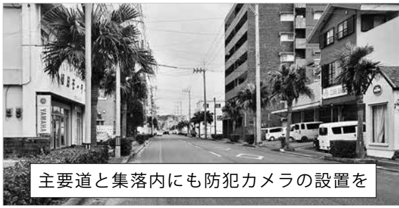
主要道と集落内にも防犯カメラの設置を

な事件・事故等の解決に防犯カメラやドライブレコーダーが重要視されている。主要道の交差点や集落内にも防犯カメラの設置はできないか。