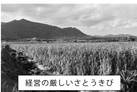
経営の厳しいさとうきび

成・補助金を行っているが、今の環境下では、農家の生活がままならない。この状況を打開するために助成制度の拡充はできないか。