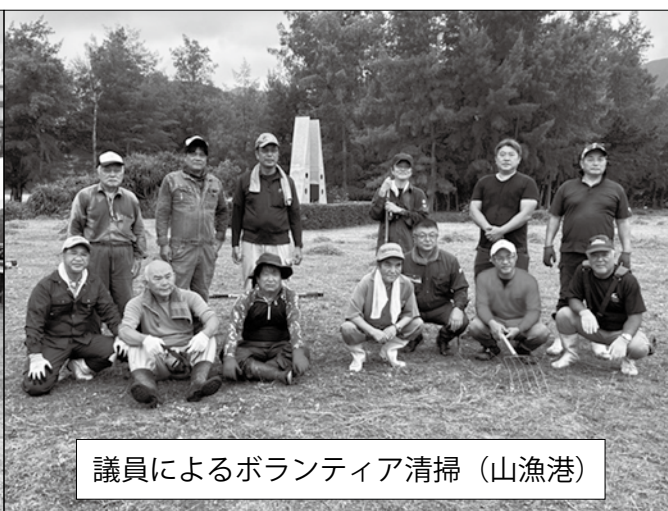
議員によるボランティア清掃（山漁港）