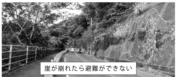
崖が崩れたら避難ができない