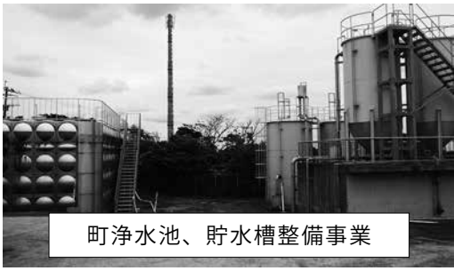
町浄水池、貯水槽整備事業