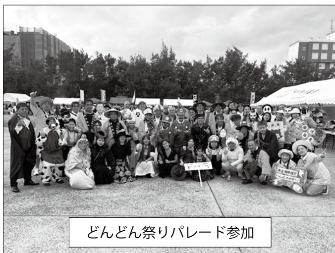
どんどん祭りパレード参加