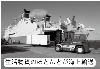
生活物資のほとんどが海上輸送

答 高城農林水産課長 林道管理は、作業員による風倒木や側溝の土砂撤去など、林道機能を保つよう適正管理を行い、現在、