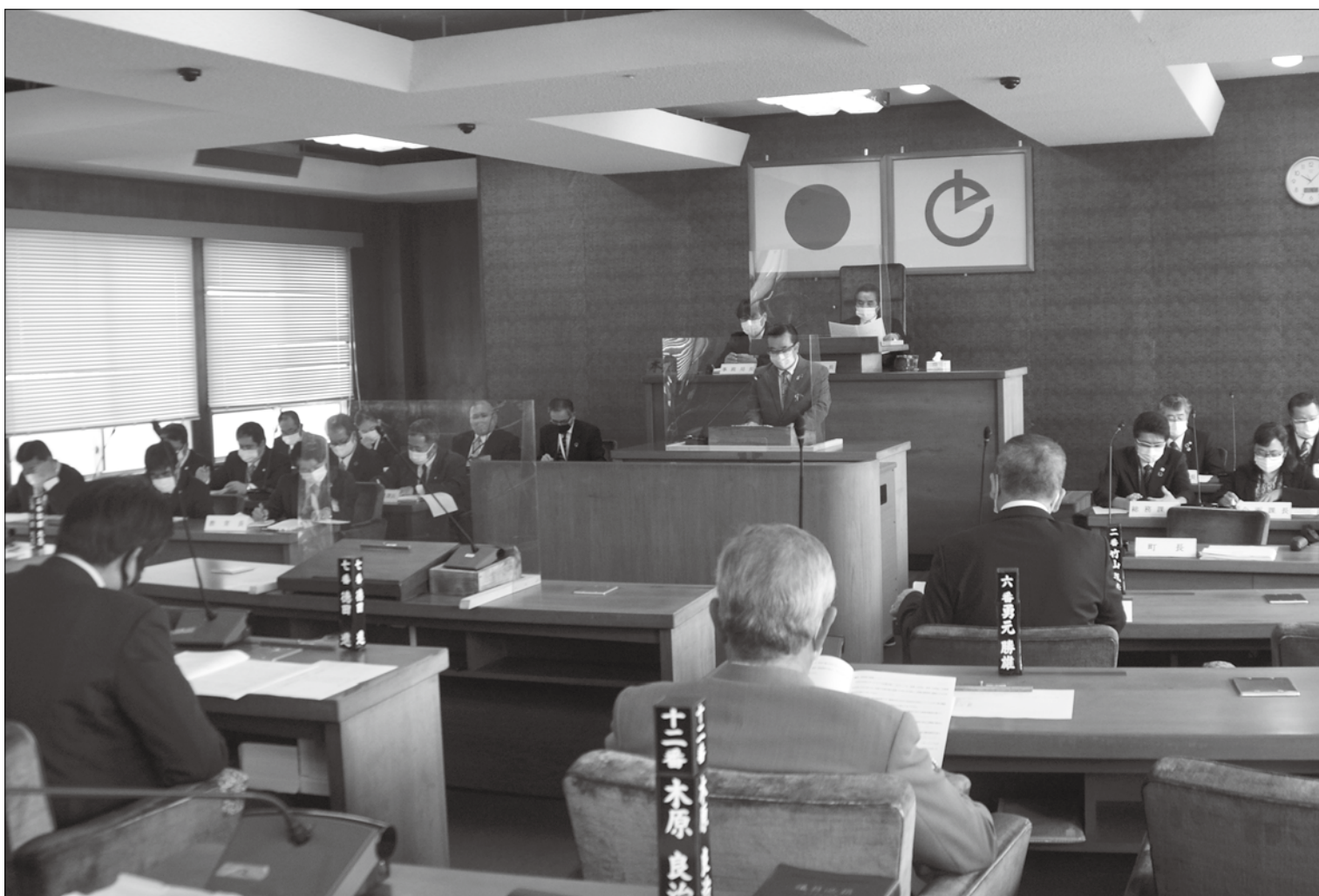
第1回定例会での高岡秀規町長による施政方針演説

発行：徳之島町議会 編集：議会広報編集委員会 〒891-7192 鹿児島県大島郡徳之島町亀津 7203 TEL 0997 (82) 1111 FAX 0997 (82) 1101