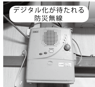
デジタル化が待たれる防災無線