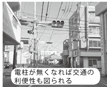
電柱が無くなれば交通の利便性も図られる

無電柱化については、高額なコスト面がネックとなるが、防災、安全、円滑な交通の確保、景観形成・観光振興、また、電線を埋設することから、停電の防止等メリットもたくさんある。和泊町、与論町などの動向を見ながら検討していく。