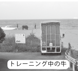
トレーニング中の牛

答 秋丸地域営業課長 徳之島闘牛連合会と協議し、闘牛所有者へ、トレーニング時のルール等、マナーの向上を働きかけている。