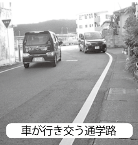
車が行き交う通学路

亀徳井之川線松田解体人口付近から旧亀徳派出所までについては、実施中の事業完成後に港ヶ丘住宅付近ポトルネック、内スパー前の三叉路・路面標示等を検討したい。