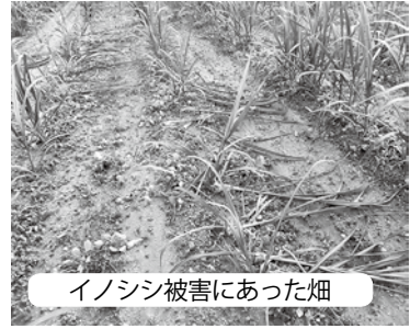
イノシシ被害にあった畑

高城農林水産課長 イノシシの被害防護には確実な方法が無く、効果的な手立てがあれば早急に実行したい。また、クロウサギについては、特別天然記念物を所管する教育委員会や環境省と、国立公園内での保護が可能か協議し