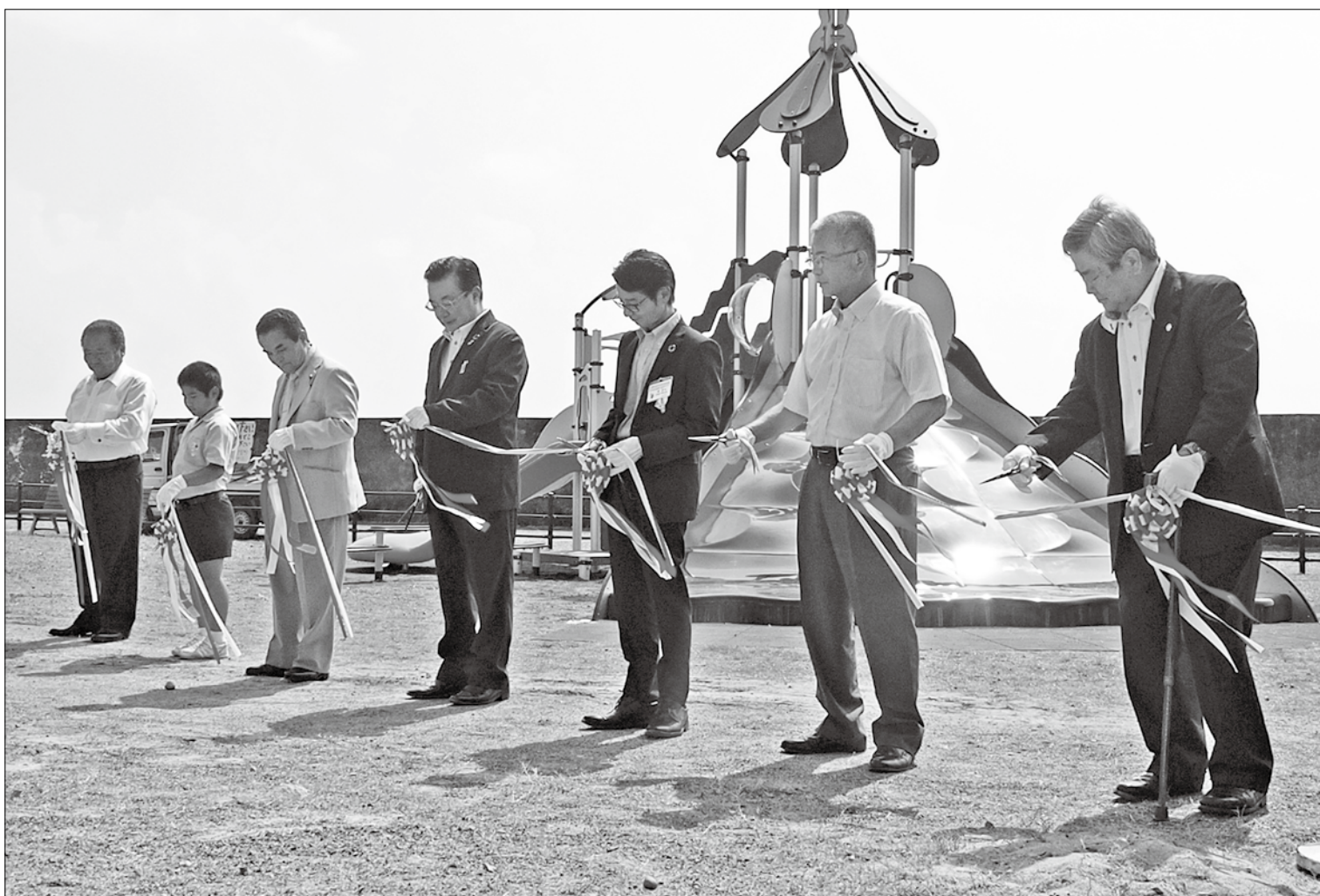
亀津児童公園遊具完成オープニングセレモニー

発行：徳之島町議会 編集：議会広報編集委員会 〒891-7192 鹿児島県大島郡徳之島町亀津 7203 TEL 0997 (82) 1111 FAX 0997 (82) 1101