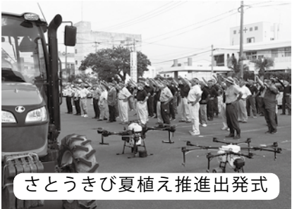
さとうきび夏植え推進出発式

答 高城農林水産課長 さとうきび作離れは、手取り感が薄いことや近年の肉用牛価格の高騰、イノシシの多大な被害などが他の作物や畜産への転換の要因とみている。