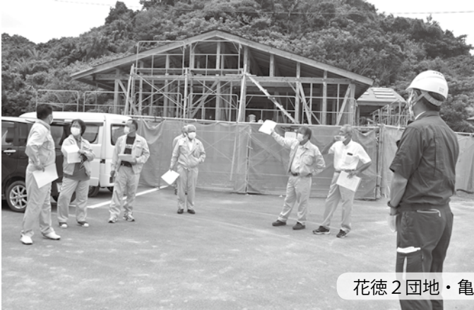
花徳2団地・亀徳浄水場を視察