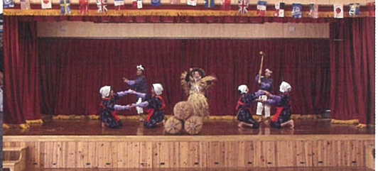
豊年天草(天城町松原西)