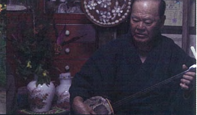
御前譜(伊仙町目手久)