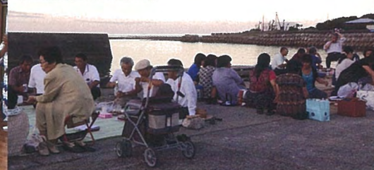
浜下り(徳之島町井之川)