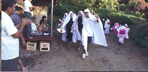
ムチタボリ(徳之島町手々)