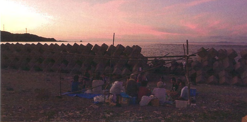
浜下り(徳之島町井之川)