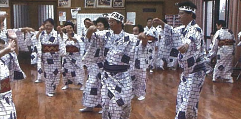
六調(徳之島町亀津)