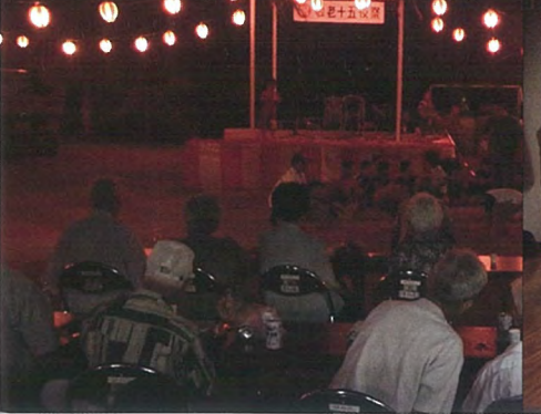
十五夜祭り(伊仙町東伊仙東)