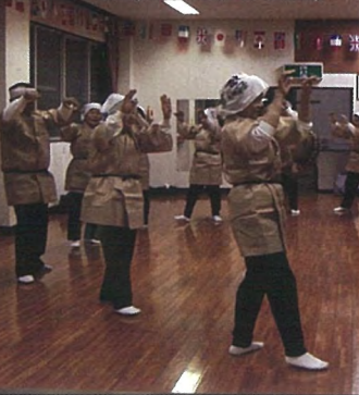
浜下り踊り(徳之島町亀徳)