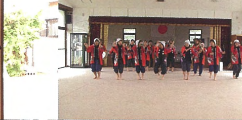
田植え歌(天城町西阿木名)