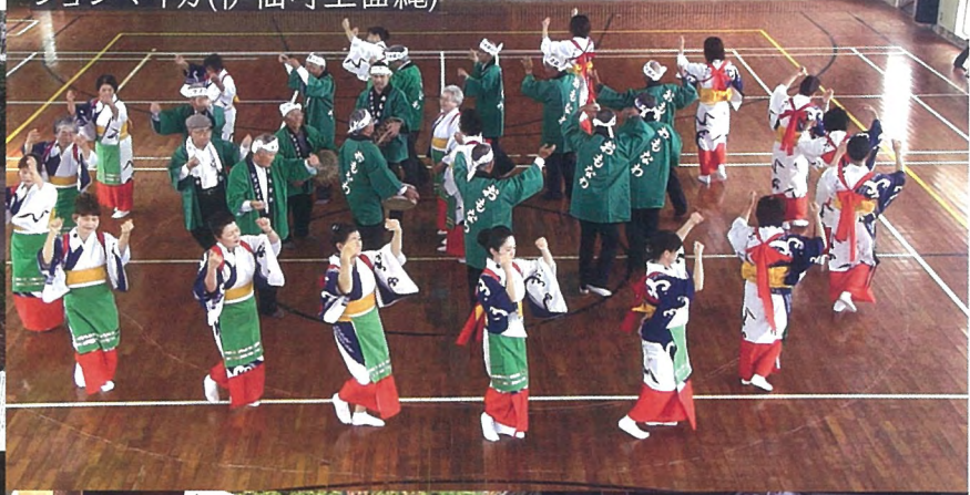
シヨンマイカ(伊仙町上面縄)