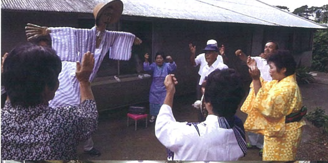
イッサンサン(伊仙町馬根)