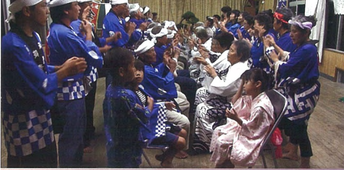
マンギアアシビ(徳之島町金見)