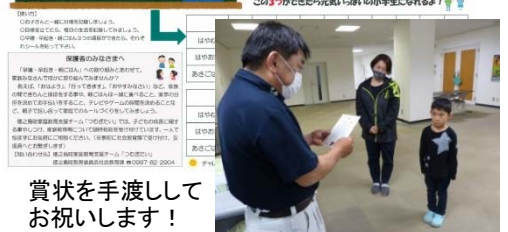
賞状を手渡ししてお祝いします!