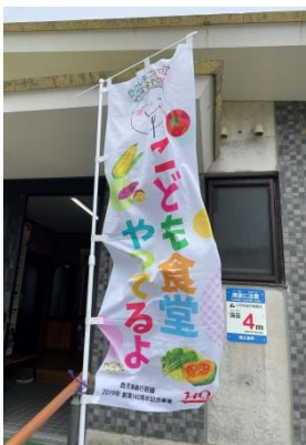
のぼりが目印です！

また、この日は徳之島診療所による、食料品と日用品の無料配布も行われ、訪れた人たちがティッシュや消毒液などの日用品や缶詰やカップ麺等の詰め合わせや新品の靴などを受けとっていました。