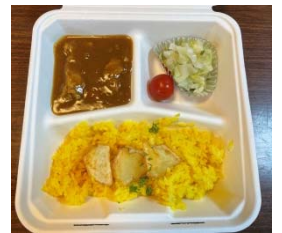
この日メインの「なんこつカレー」

4月10日、東区公民館に開設されたこども食堂には、ボランティアの運営スタッフ6人が調理と会場設営を担当。この日のメニューは、「なんこつトロトロカレー」と「キャベツの酢漬け」「ポテトフライ」「ミニトマト」「ゼリー」の5品でした。こども食堂の食材は、地元の方の食材提供や、寄付、かごしまこども食堂地域食堂ネットワークからの食材提供等からまかなっており、いただいた食材で毎回メニューを考え、これまでに新ジャガコロッケやカンパチフライ、イノシシカレー等が提供されたとのことでした。