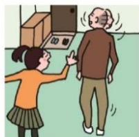
目を離せない家族の見守りや声かけなどの気づかいはしている