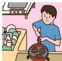
障がいや病気のある家族に代わり、買い物・料理・掃除・洗濯などの家事をしている