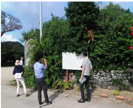
近世期の面縄港湾の確認