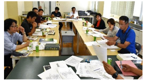
先史・古代・中世部会会議