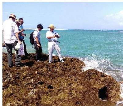
井之川の港湾の確認