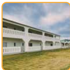
徳之島リゾート&オフィス