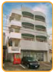
ウィークリーマンション七福人