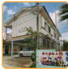
ペンション七福人