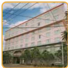
ホテルグランドオーシャンリゾート