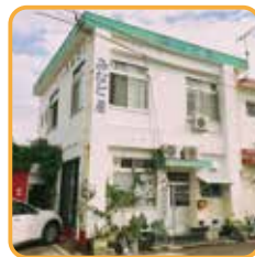
ゲストハウス みなと屋