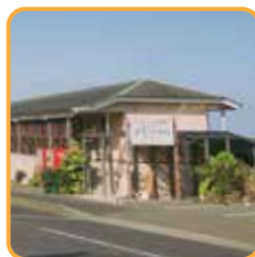
遊学リゾート きむきゅら