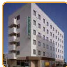
ホテル・レクストン徳之島