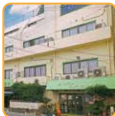
ホテルニューにしだ