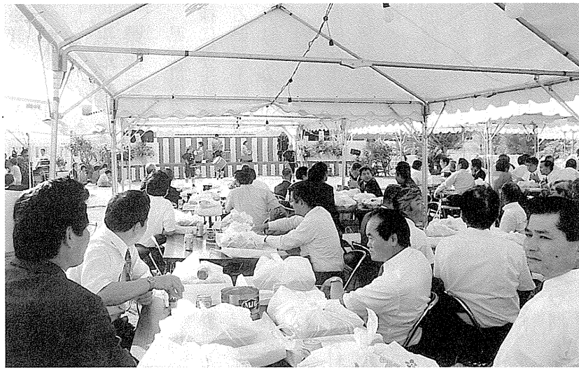
約250名の関係者が出席して盛大に行われた祝賀会

切に、将来は島でもコンピュータ・トレンドの仕事ができるよう実現し、徳之島の発展につなげたい」と、あいさつしました。