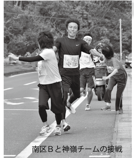
南区Bと神嶺チームの接戦