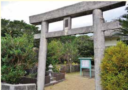
住民に尊崇されていたウシシギヤを祭る神社