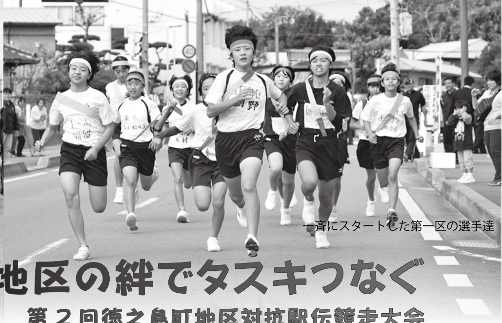
一斉にスタートした第一区の選手達