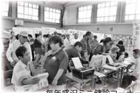
毎年盛況ミニ健診コーナー