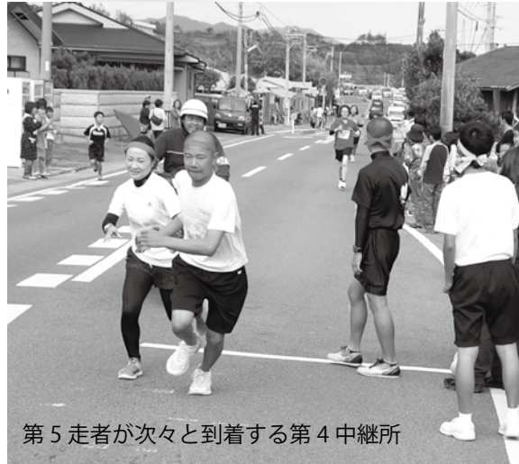
第5走者が次々と到着する第4中継所