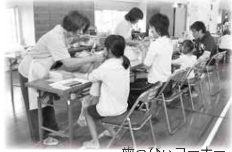
歯っぴいコーナー