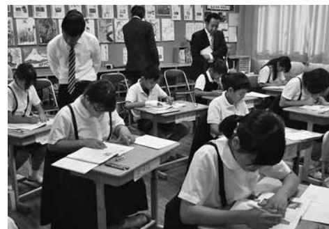
【神之嶺小 校内研修】