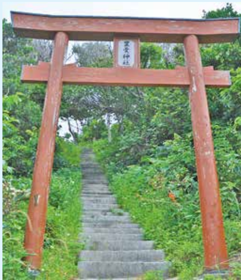
集落を望む高台に建つ豊受神社

のが、町指定文化財の「豊受神社」です。神社は、大正10年頃に建立されたと言われているのですが、元々鍛冶神を祭る神聖な場所だったこともあり、戦後しばらくは島内中から参拝者を集めていたそうです。時代の流れに伴って訪れる人々も減り、一時は荒れた状態になっていましたが、地元の高齢者クラブの皆さんが主体となって新たな鳥居を建てて復興を図り、再び集落の守り神として崇められるようになりました。