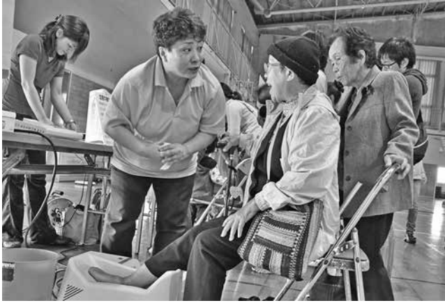
血管年齢の測定を受ける人