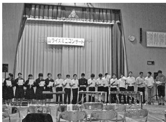
練習を重ねた歌を披露する生徒と先生

地域社会で「主体性、企画力、調整力を身につけさせる」を目的として、平成14年に発足した中・高校生クラブ「フロンティア21山」の活動の一環として、毎年開催しています。今年は11月9日に山中学校体育館で開かれ、地元小中学生がこの日に向けて練習を重ねた歌や踊りが披露されました。樟南第二高校吹奏楽部や地区内外の先輩方による友情出演が、秋の夜の音楽会に華を添えてくれました。