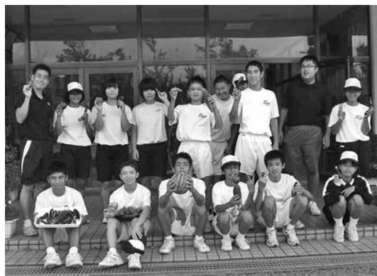
自分たちで育てた野菜を収穫

5月に学級園で野菜作りに挑戦し、7月12日に収穫しました。自分たちで育てたトマトやピーマン、ナスやキュウリの他、魚釣りや貝採りで海の幸も集め、全生徒で調理し給食時間に味わいました。生徒たちは、この学習を通して徳之島の自然に触れ、郷土の良さを改めて考える機会になっています。