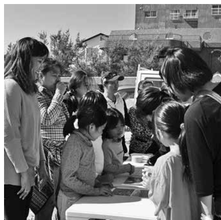
食と農林漁業の祭典会場で義援金の呼びかけ

徳之島在住のフィリピン出身者5名が、「2013年フィリピン台風救援金」の募金を呼びかけました。集まった義援金は、日本赤十字社を通じてフィリピンへ贈られます。