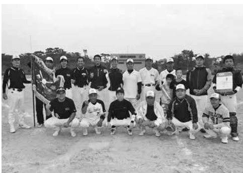
初優勝を喜ぶ北区チーム