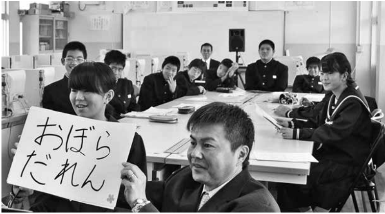
パネルを使い徳之島の方言を説明する生徒

東天城中学校で11月21日、タイのチュラロンコーン大学とウェブ会議システムで結んだ国際交流授業が開かれました。同校の1年生12名、同大学文学部日本語学科4年生翻訳専攻17名が参加。テレビ会議システムを通じ、お互いの地域の魅力や文化の特色について理解を深め、交流しました。