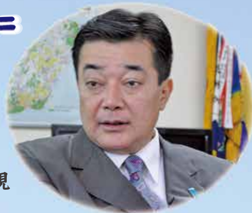
徳之島町長 高岡 秀規