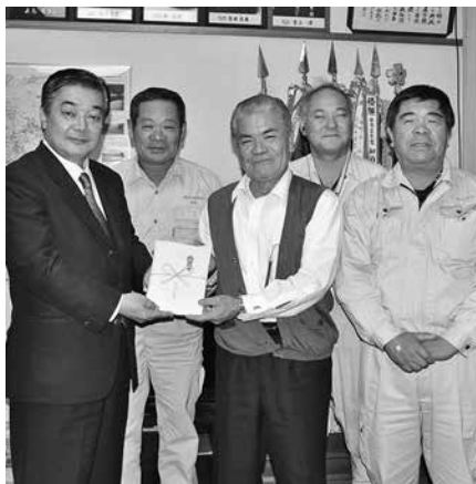
徳之島建設業協会の代表者のみなさん

11月22日、徳之島建設業協会から徳之島町へ「町政発展に生かしてほしい」と寄附金の贈呈がありました。寄附金の額は200万円。町の発展の為、大切に活用していきます。