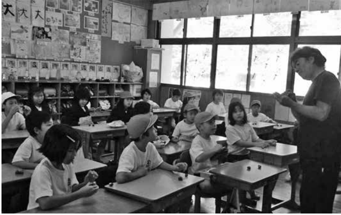
漁業集落組合員の話聞く子どもたち

徳之島町地区漁業集落 ヤコウガイ稚貝放流事業 徳之島町地区漁業集落主催の稚貝放流事業は、ヤコウガイの生態や環境保全の周知のために行われていきます。 子どもたちが白いふたに名前や絵を書いた稚貝は、成長を願い育ちやすい場所を選んで放流されました。