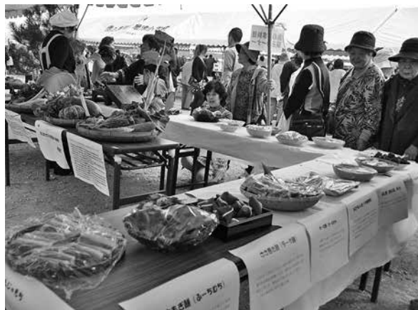
懐かしい昔のお菓子やお祝い膳の再現展示

「第1回徳之島町食と農林漁業の祭典」が11月24日、亀津新漁港で青空の下に開催されました。町内外から大勢の住民が来場し、地元産品の安価な販売や舞台イベント、グルメコンテストなどで一日中にぎわいました。 野菜と魚の販売や特産品の試食販売、バザーやフリーマーケットなどは買い物客であふれ、さとうきび重量・糖度当てクイズなどのゲーム、工作や実験コーナーでは子どもから大人までが楽しんでいました。