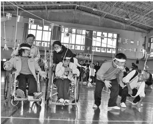
白熱のパン食い競争

町体育センターで11月22日、30回目の節目となる「徳之島町福祉スポーツ大会」(徳之島町社会福祉協議会主催)が開催されました。福祉施設利用者や関係団体から参加した選手は、思い思いのペースで競技をこなし、互いに助け合いながら親睦を深めました。