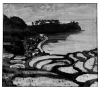
寄贈された作品のひとつ 「夕映えの棚田」

いずれの作品も、色彩鮮やかで明るい画風の作品ばかりで心がなごみます。ぜひ多くの方が絵画をご鑑賞くださいますようご案内いたします。