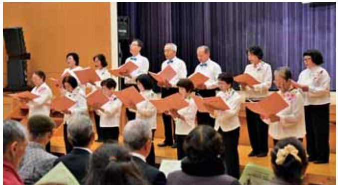
素敵な歌声を響かせた「歌声のつどい」教室