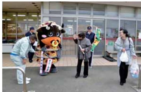
一日署長として広報活動をするまぶーる君

1月10日、徳之島町の公式キャラクター「まぶーる君」が徳之島警察署から一日署長に委嘱されました。110番の適正な利用を呼びかけるキャンペーンなどに参加しました。同署は亀津中学校体育館でのまぶーる君への委嘱式の後、110番の適正な利用について署員による亀津中生徒への講話も実施。講話終了後はAコープ徳之島店、伊仙店で、まぶーる君や関係者が広報を行い、チラシや夜光反射材などを配布して買い物客らへ110番の適正な利用について呼びかけました。