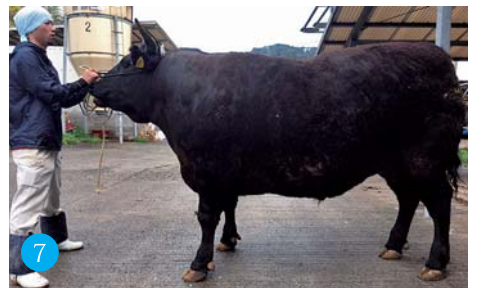
①福岡さんの牛舎で生まれた子牛 ②子牛生産農家の福岡宮助さん(右)と祐希さん(左) ③5,000頭を肥育する「のざき畜産」の広大な農場 ④牛の穀物消費量が多いときには1日10キロ以上も ⑤老舗「ミートショップ高島」 ⑥のざき牛特選サーロインステーキ ⑦のざき畜産で肥育された牛