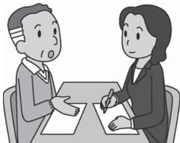
消費者庁イラスト集より