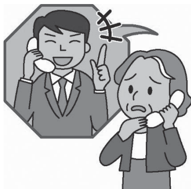
消費者庁イラスト集より