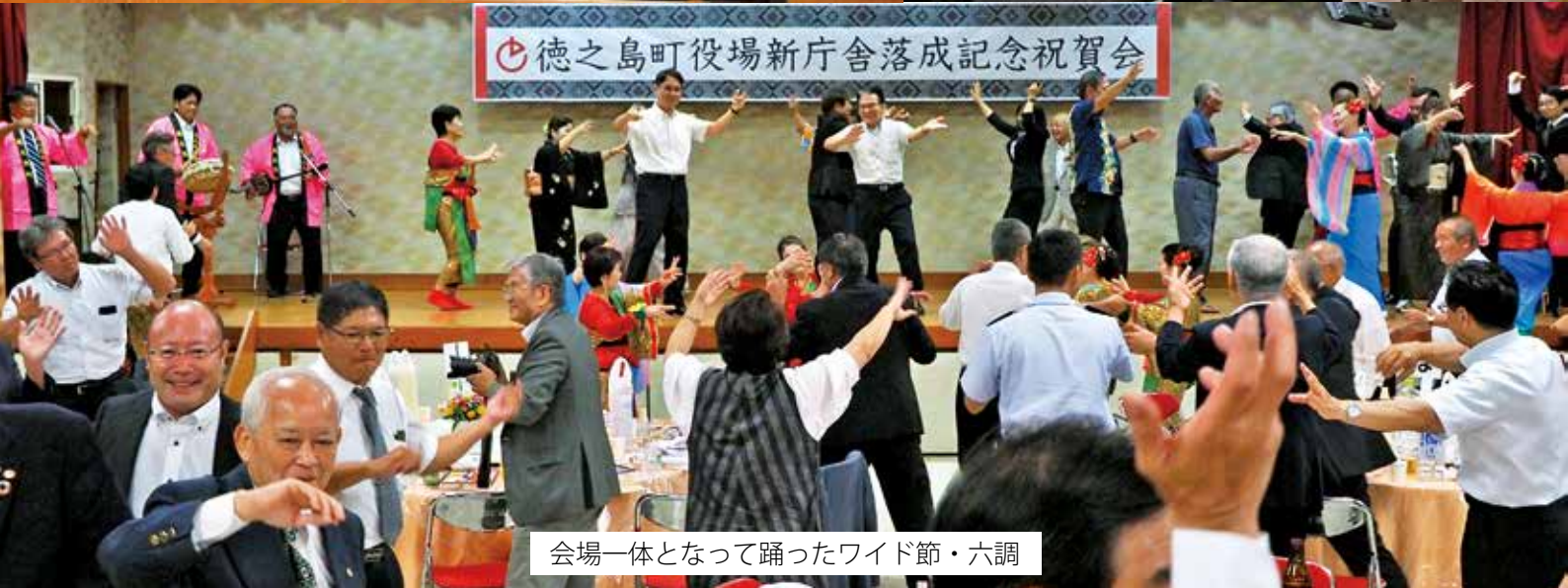
会場一体となって踊ったワイド節・六調