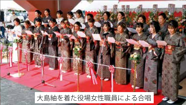
大島紬を着た役場女性職員による合唱