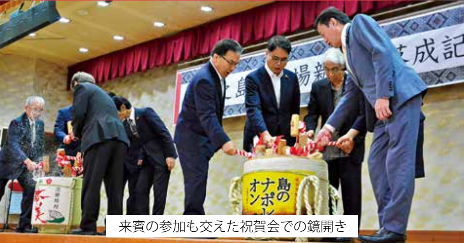
来賓の参加も交えた祝賀会での鏡開き