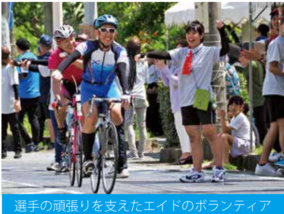
選手の頑張りを支えたエイドのボランティア

「第36回トライアスロンIN徳之島大会」が6月25日、総合の部に365人、リレーの部に46組が参加し、島内一円をコースに開催されました。昨年は台風の影響により、ランとバイクの「デュアスロン形式」に変更となったため、本来のスイム・バイク・ランでの「トライアスロン」としての実施は実に4年ぶり。当日は真夏日の過酷なレースとなりました。バイクコースの一部となった徳之島町では、北部から南部にかけて鉄人たちが疾走。町民ボランティアによるエイドステーションや交通整理、沿道からの大きな声援が選手への頑張りを支えました。