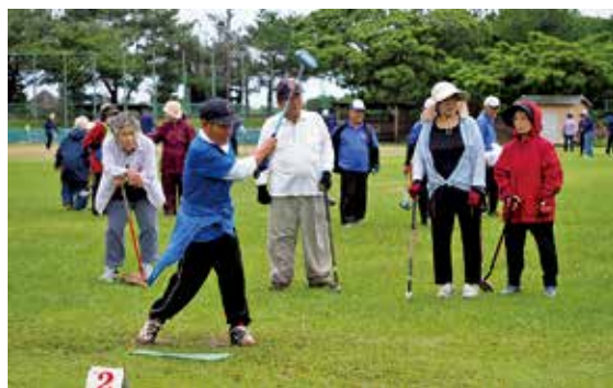
3年越しで念願の開催となった大会

特別国民体育大会「燃ゆる感動かごしま国体」ふれあいグラウンドゴルフ大会が6月18日、町健康の森総合運動公園でありました。かごしま国体は当初2020年に開催予定でしたが、新型コロナの影響により延期。今回3年越しの開催となり、「奄美群島日本復帰70周年記念」の冠称をつけての大会となりました。大会には徳之島3町から40チーム約200人が参加。当日の朝は雨天で開催が危ぶまれましたが、昼頃には晴れ間が見え始め、選手は和気あいあいとした様子で競技を楽しみました。