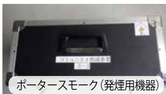
ポータースモーク(発煙用機器)

「令和5年度コミュニティ助成事業」の「地域防災組織育成事業」として、徳之島地区消防組合が事業実施主体となり、ポータースモーク(発煙用機器)を整備しました。これは、一般財団法人自治総合センターが宝くじの普及広報活動の一環として、安全な地域づくりと共生のまちづくり等に対し助成を行っているものです。今後も地域防災を担うよう徳之島町女性防火クラブの活躍が期待されます。