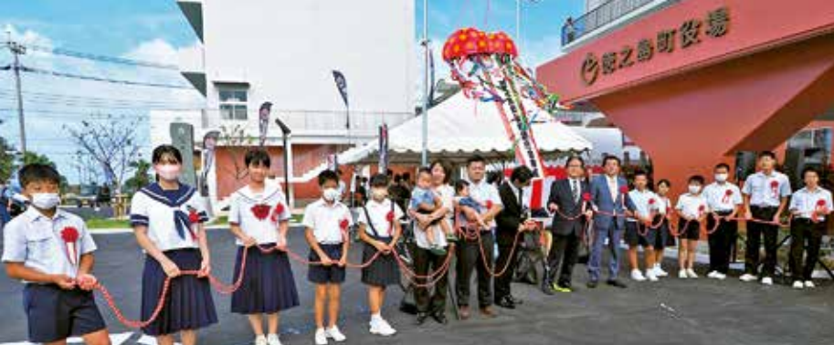
新生児家族・町内各小中学校の児童生徒によるくす玉割り