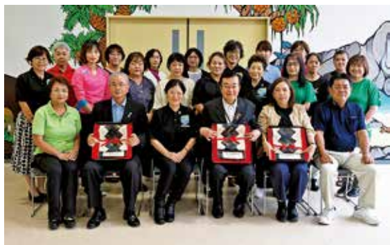
徳之島町地域女性連の皆さんと町関係者

徳之島町役場新庁舎の落成を記念し、町地域女性団体連絡協議会から本町へテーブルセンターの寄贈がありました。6月24日、役場で贈呈式がありました。テーブルセンターは大島紬や芭蕉布などの島特有の素材を使用。女性連の皆さんが協力し、「できる人が」「できることを」「できるときに」を合言葉に、一針一針思いを込めて約3ヶ月かけて制作。計3枚のテーブルセンターを寄贈いただき、当日早速、町長室、副町長室、教育長室の応接テーブルに置かれ、来客を迎えました。