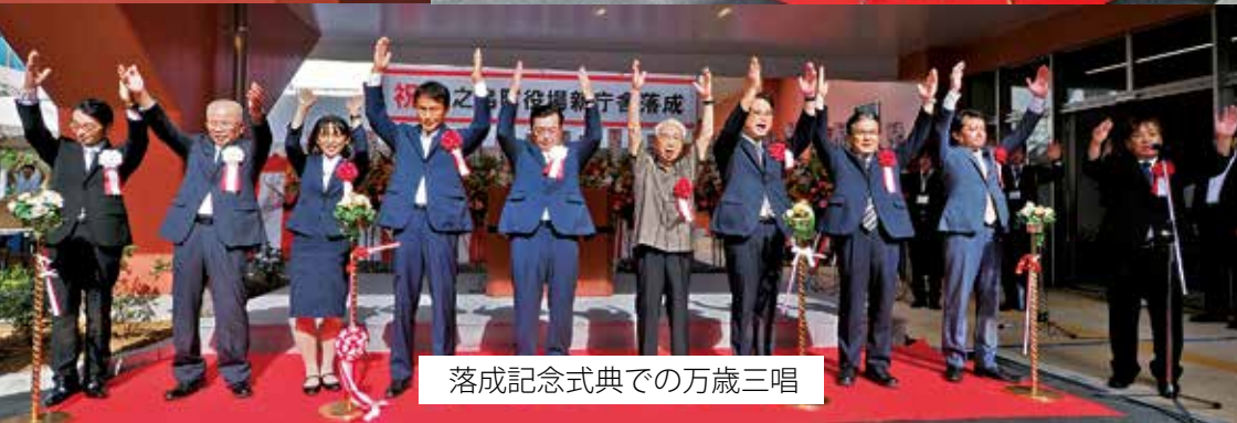
落成記念式典での万歳三唱