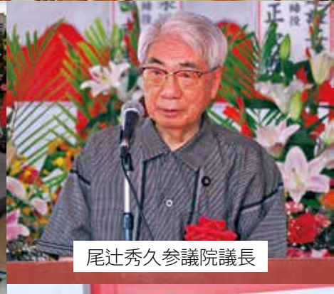
尾辻秀久 参議院議長