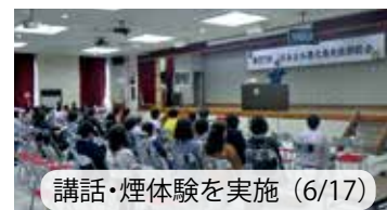
講話・煙体験を実施(6/17)