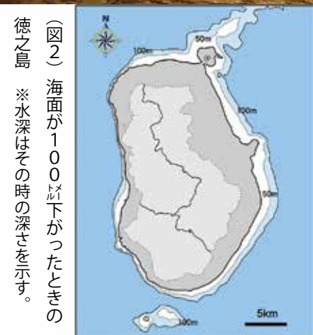
（図2）海面が100m下がったときの徳之島 ※水深はその時の深さを示す。

これまで何気なく見ていた風景も知識を得ると思わぬ発見があります。興味深く見ることができるようになります。せっかく世界自然遺産登録地の徳之島に住んでいるのですから、徳之島のことをもっとたくさん知って大いに楽しみませう。『徳之島町史 自然編』もぜひお買い求めください。