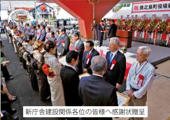
新庁舎建設関係各位の皆様へ感謝状贈呈