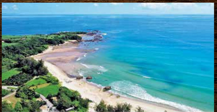
（図3）花徳浜の前に広がる海。1万年後、この先5km以上が陸地になるかもしれない。

つまり徳之島町側の縄文草創期の遺跡は、海の中にある可能性が高いわけですね。もともとも陸地の姿は一定だったわけではなく、大きな浮き沈みを繰り返しながら島々は成長していきます。例えば、標高約200メートルの亀津の高原などは40万年前は海岸線でした。また、亀津市街地は60メートル前後の段丘で囲まれています。そこは10万年余り前までの海岸線です。徳之島南部域は琉球石灰岩でおおわれていますが、これはこの地域が過去40万年ほどの間に持ち上がったことを示します。逆に大島本島側は沈み、山の部分が残っています。その様子は、船から徳之島の形をよく見るとわかります。南から北にかけて少し傾斜している様子が見て取れます。