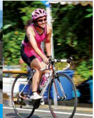
高低差の激しいバイクコースを疾走する選手たち

「第36回トライアスロンIN徳之島大会」が6月25日、総合の部に365人、リレーの部に46組が参加し、島内一円をコースに開催されました。昨年は台風の影響により、ランとバイクの「デュアスロン形式」に変更となったため、本来のスイム・バイク・ランでの「トライアスロン」としての実施は実に4年ぶり。当日は真夏日の過酷なレースとなりました。バイクコースの一部となった徳之島町では、北部から南部にかけて鉄人たちが疾走。町民ボランティアによるエイドステーションや交通整理、沿道からの大きな声援が選手への頑張りを支えました。