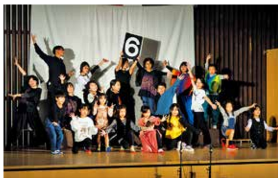
「マジカル」な世界観のミュージカルを発表