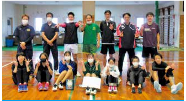
初優勝となった花徳チーム