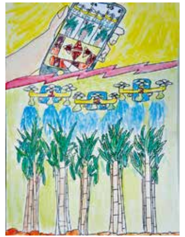
【南西糖業賞】 榮 あんな(亀津小)