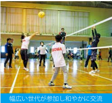
幅広い世代が参加し和やかに交流