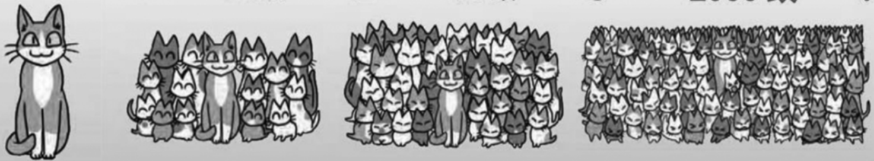
「捨てず増やさず飼うなら一生」環境省パンフレットより

1頭のメス猫が・・・1年後には 20 頭以上・・・2年後には 80 頭以上・・・3年後には 2000 頭以上に！