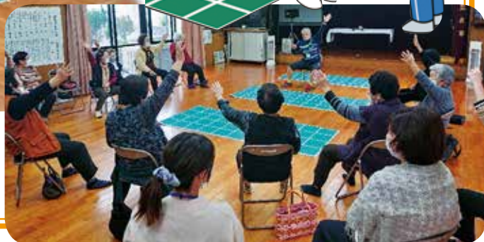
スクエアステップ・エクササイズの様子【南区地域サロン】