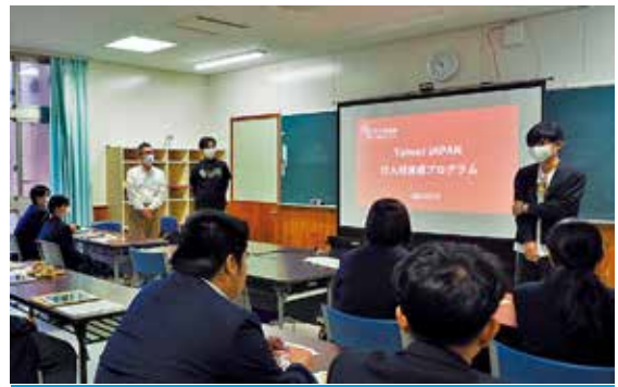
仮想オンラインショップの運営を体験

徳之島高校で12月17日、Yahoo! JAPANの「IT人財育成プログラム」を活用した特別授業がありました。授業は町とソフトバンク株式会社の事業連携協定に基づく「離島における教育課題解決及びSDGs未来都市計画推進」の一環。Yahoo! JAPAN社員が講師となり、同校の2年生12人が、仮想オンラインショップの運営体験を通じWEBマーケティングについて学びました。今回の授業は全8回のうち5回目。今後もITの利活用に関心強い人材育成が期待されます。