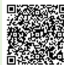
Google Play (Android)