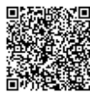
App Store (iOS)