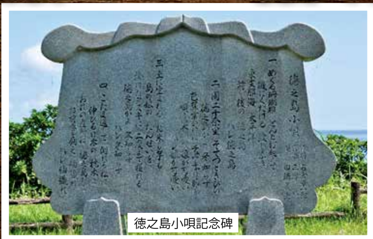
徳之島小唄記念碑

ここで取り上げたことからの他にも、明治・昭和初期のシマの様子を轟木集落の記録からはうかがえます。徳之島において、この時代の集落を伝える記録は他には見あたらず、貴重な歴史