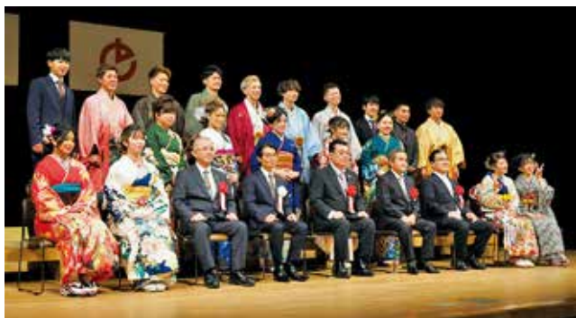
町文化会館での成人式は2009年以来12年ぶり