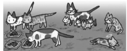
「もっと飼いたい？」環境省パンフレットより