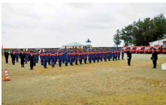
亀津児童公園での規律訓練