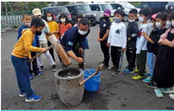
「よいしょ！」と元気な掛け声でもちつき

町食品加工センター「みのり館」で12月28日、年末のもちつき大会がありました。コロナ禍で子ども達が楽しめるイベントが少ない中、「少しでも楽しいイベントが増えれば」と、みのり館を運営する町地域営業課が企画。「神之嶺スポーツ少年団」と学童クラブ「キッズハウスさんぽみち」の子どもたちを招待し、約60人が参加しました。同館の屋外で炊かれたもち米は全部で15kg。子どもたちはつきたてのおもちにあんこやきなこをつけ、おいしそうにほお張っていました。