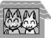
「宣誓！無責任飼い主0宣誓！！」環境省パンフレットより

各町の飼い猫の適正な飼養及び管理に関する条例を守り 最後まで愛情と責任をもって飼いましょう！