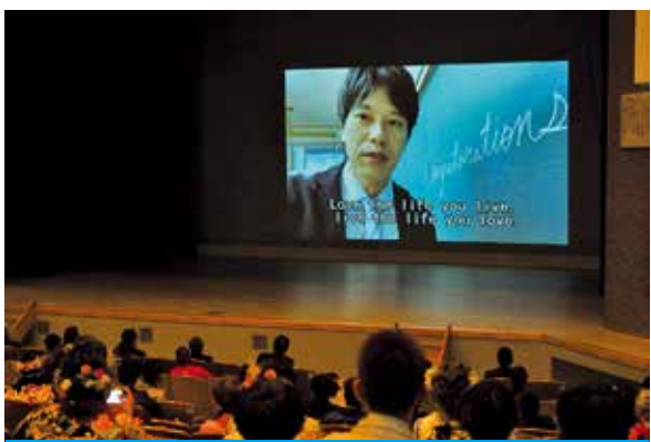
恩師から届けられたビデオメッセージ

「令和4年成人式」が1月2日、町文化会館で開催されました。前年の成人式は新型コロナウイルスの影響で5月に延期され、オンライン形式のみでの開催となりましたが、今年是对象者136人のうち99人が式典に出席。町がPCR検査費用を全額助成し、出席者は全員が検査を受けるかワクチンを接種した上での参加となりました。ライブ配信もされた式典では、新成人12人が事前に用意したビデオメッセージで抱負を語り決意を表明。式典終了後は、各小中学校の卒業アルバム写真とともに恩師からのビデオメッセージが紹介され、新成人の新たな門出を祝いました。