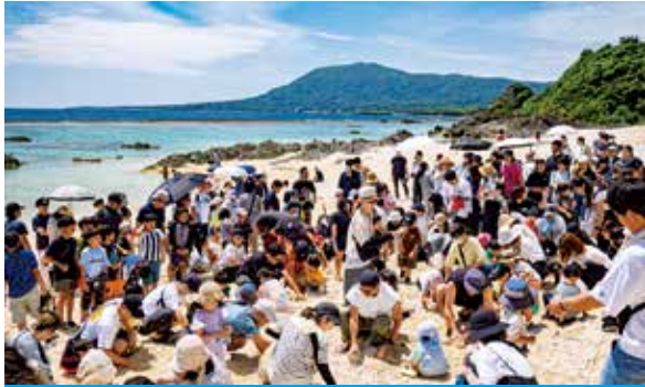
子どもたちの歓声が響いたビーチでの「宝探し」