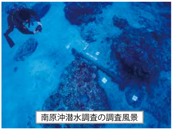
南原沖潜水調査の調査風景