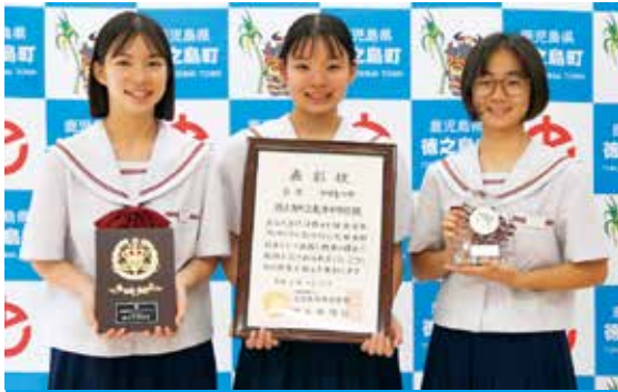
快挙を達成した管打三重奏のメンバー