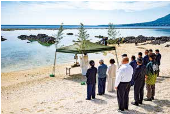
「海開き」の神事で安全祈願