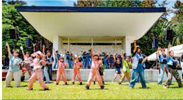
多彩な演目が披露されたステージイベント