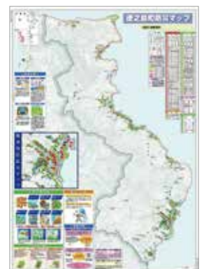
【徳之島町防災マップ（全体図）】