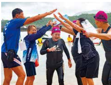
完泳した選手をあたたかく出迎え