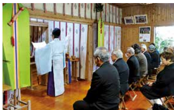
遺族や関係者が玉串を奉納し戦没者を追悼

「第39回徳之島町福祉スポーツ大会（町社会福祉協議会主催）」が11月21日、町体育センターでありました。障がい者や福祉関係者等が親睦を深め、住みよい町づくりを進める同大会は、今回から午前の開催に。町母子寡婦福祉会等の16の団体が参加し、パン食い競争や玉入れ、車いすリレーなど計10種目の競技を通じて、参加者はたくさん笑顔に溢れる楽しいひとときを過ごしました。同大会は、赤い羽根共同募金の分配金で運営されています。