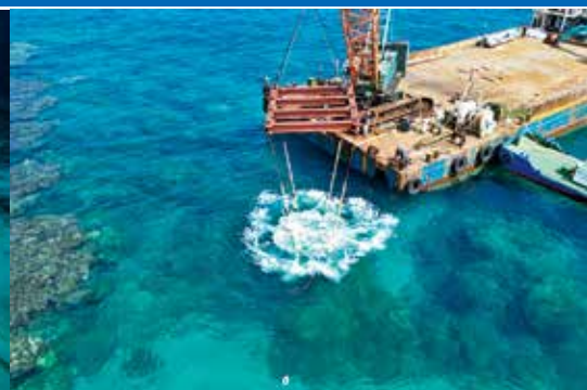
井之川の沖合に沈められる水中彫刻

進められます。 金の運用検討が 全のための協力 利用する場合のルール作り、環境保 全のための協力 金の運用検討が 進められます。