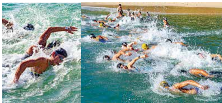
日本選手権トライアルとしても行われた 10km・5km 競技