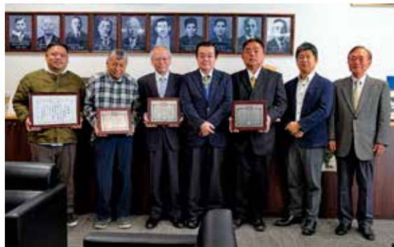
町役場での表彰伝達式に出席された皆さん

令和7年度徳之島地区ゆめ・ときめきねりんスポーツ大会が11月29日、町体育センターで開催されました。徳之島3町の高齢者クラブが開催する本大会は3町の輪番制で、今年は徳之島町が担当し開催。徳之島町、天城町、伊仙町からそれぞれ2チームずつ、合計約300人が参加しました。バレーボールを頭の上のせて運ぶリレー「島の娘」や、会場全体で踊るマスゲームなど、10の種目を通じて、会員同士の親睦を深めました。来年度の大会は伊仙町での開催が予定されています。