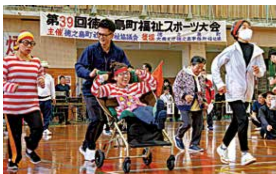
今回から午前開催となった福祉スポーツ大会