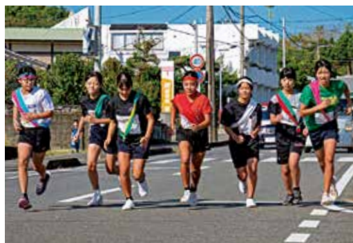
第1区のスタートを切る小学生女子選手達