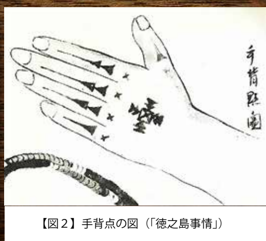
【図2】手背点の図（「徳之島事情」）

あるマムシとハブとを比べています【図1】。また、「女は齒黒の代わりに、手の裏表に、いろいろ黒赤の入ほくろ紋所のようなものを付けるよし」とも。「ハジキ」といわれた女性たちの入れ墨です【図2】。