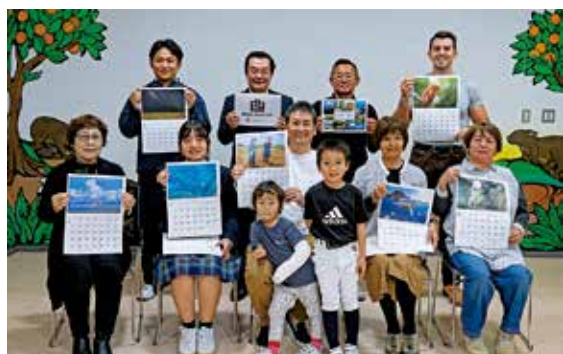
受賞作品のページを開き、笑顔の受賞者の皆さん