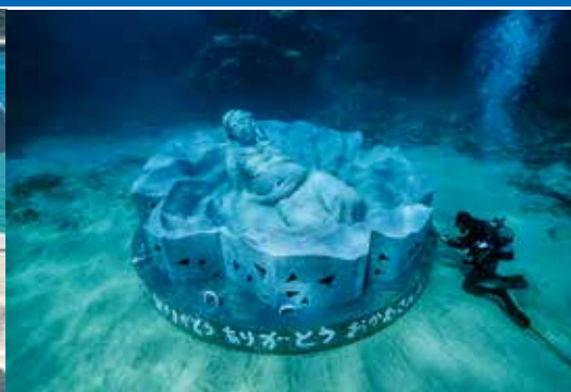
彫刻側面には生き物たちの棲み処となる穴が