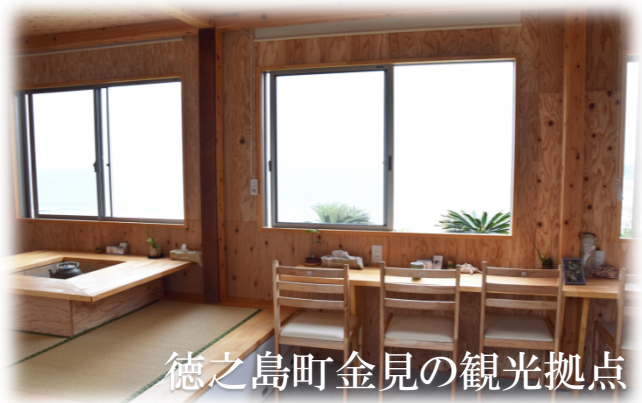
徳之島町金見の観光拠点！

ジビエカフェ「とうぐら」は地域の旬の食材を利用した地元料理や、北部地域の観光拠点としての機能を持ち、太平洋を見渡せる絶景スポットに整備されています。