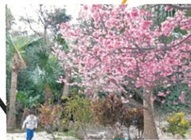
運が良ければ 「うなんぎやなし」が 見えます