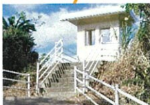
展望台から望む景色は絶景