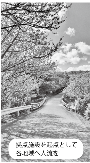
拠点施設を起点として各地域へ人流を