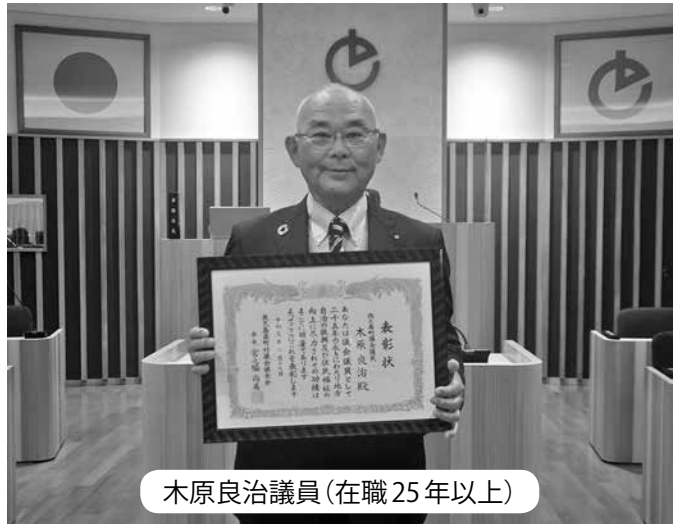
木原良治議員 (在職 25 年以上)