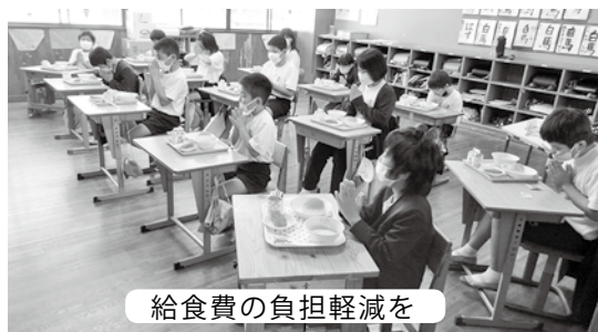
給食費の負担軽減を