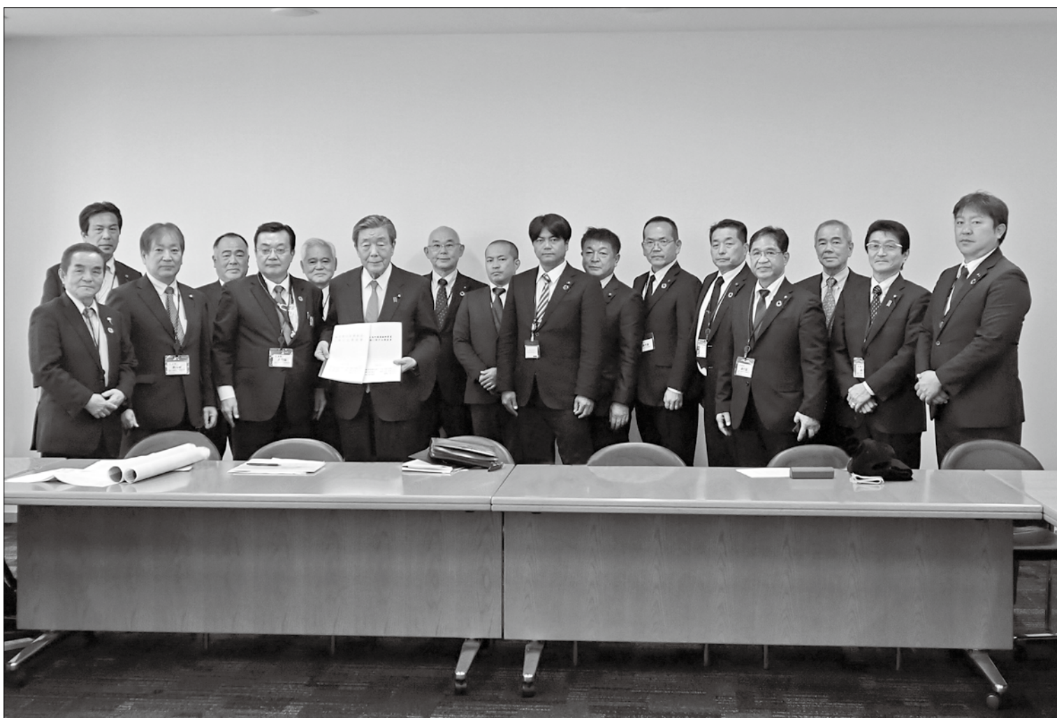
自民党港湾議連 森山裕 会長へ要望書を提出（衆議院会館にて）

発行：徳之島町議会 編集：議会広報編集委員会 〒891-7192 鹿児島県大島郡徳之島町亀津 7203 TEL 0997 (82) 1130 FAX 0997 (82) 1101