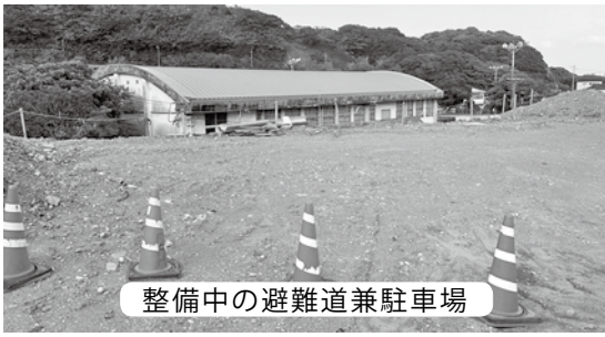
整備中の避難道兼駐車場