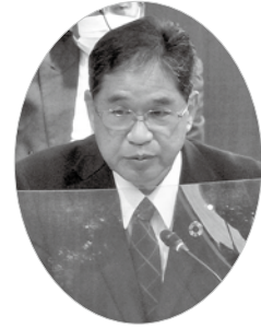
宮之原 剛 議員

問 子育て支援は喫緊の課題、国の「出産・子育て応援交付金」を受けて、今後の取り組み状況と町独自の支援の計画を伺う。