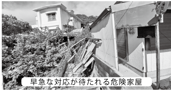
早急な対応が待たれる危険家屋

全な危険家屋もあり「徳之島町空き屋等の適正管理に関する条例」や施行規則に基づき、早急な対応とNPOや民間団体と連携し、今後の空き家対策ができないか伺う。