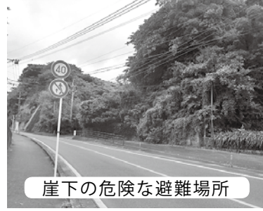
崖下の危険な避難場所

亀徳の県道と町道が交差する崖下が町指定の避難場所になっている。その場所は狭く崖下で非常に危険。安全な場所の確保の為、阿田野平住宅までの崖の切り取りと未整備の歩道の整備を県に要望できないか伺う。