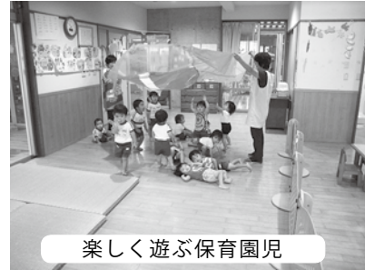
楽しく遊ぶ保育園児

答 高岡町長 医療費については、現在、国民健康保険事業は、県が事業主となっている。助成制度については、県と歩調を合わすべきと考えている。更には、国保会計による保険税を算出するに保険税を上げなければならぬ。しっかりと、医療の抑制に努め税額をできる限り維持していきたいと考える。