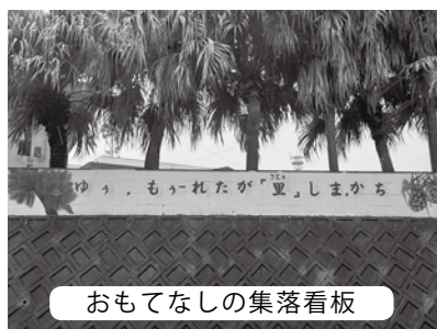
おもてなしの集落看板

問 ワクチン接種が開始されたが、余剰ワクチン発生時の扱いについて取り決めはされているか。また、世界自然遺産登録が決定すれば新規来島者の急増が想定される。各集落、観光地等の案内看板設置はできないか。