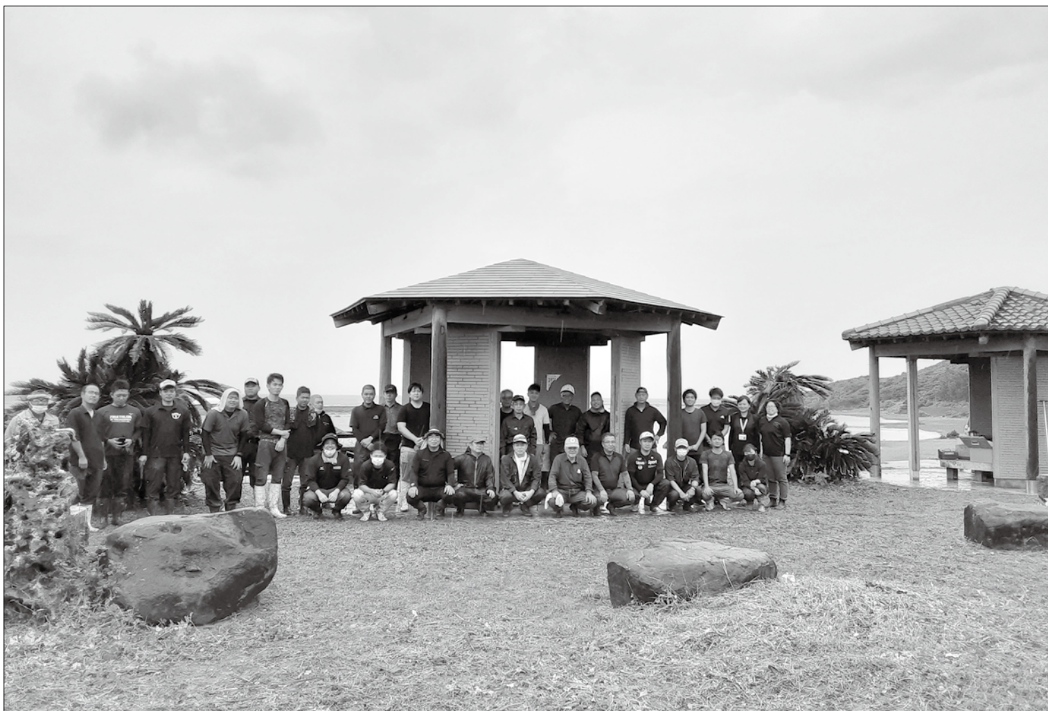
7月2日に実施された手々海浜公園の美化清掃作業

発行：徳之島町議会 編集：議会広報編集委員会 〒891-7192 鹿児島県大島郡徳之島町亀津 7203 TEL 0997 (82) 1111 FAX 0997 (82) 1101