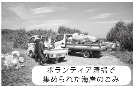
ボランティア清掃で集められた海岸のごみ

問 海岸・海中ボランティア清掃後のごみの取扱いはどうなっているか。また、災害ごみはどう処理したいか。