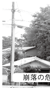
崩落の危険性のある岩