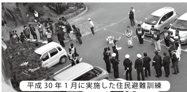
平成30年1月に実施した住民避難訓練

災組織、住民が協力し、避難計画や避難経路等を作成し、地域の実情に応じた避難訓練を行い、命を守って頂きたい。