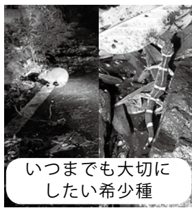
大切にも大切に 大切にしたい

今後、世界自然遺産登録により観光客の増加も考えられるので、交通担当と協議し対策を講じる。