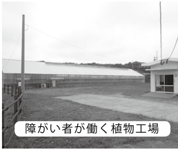
障がい者が働く植物工場

通常の事業に雇用されるのが困難な方に、働く場を提供するとともに、知識及び能力向上のために必要な訓練を行い、一般就労後の職場定着のための支援を行っている。