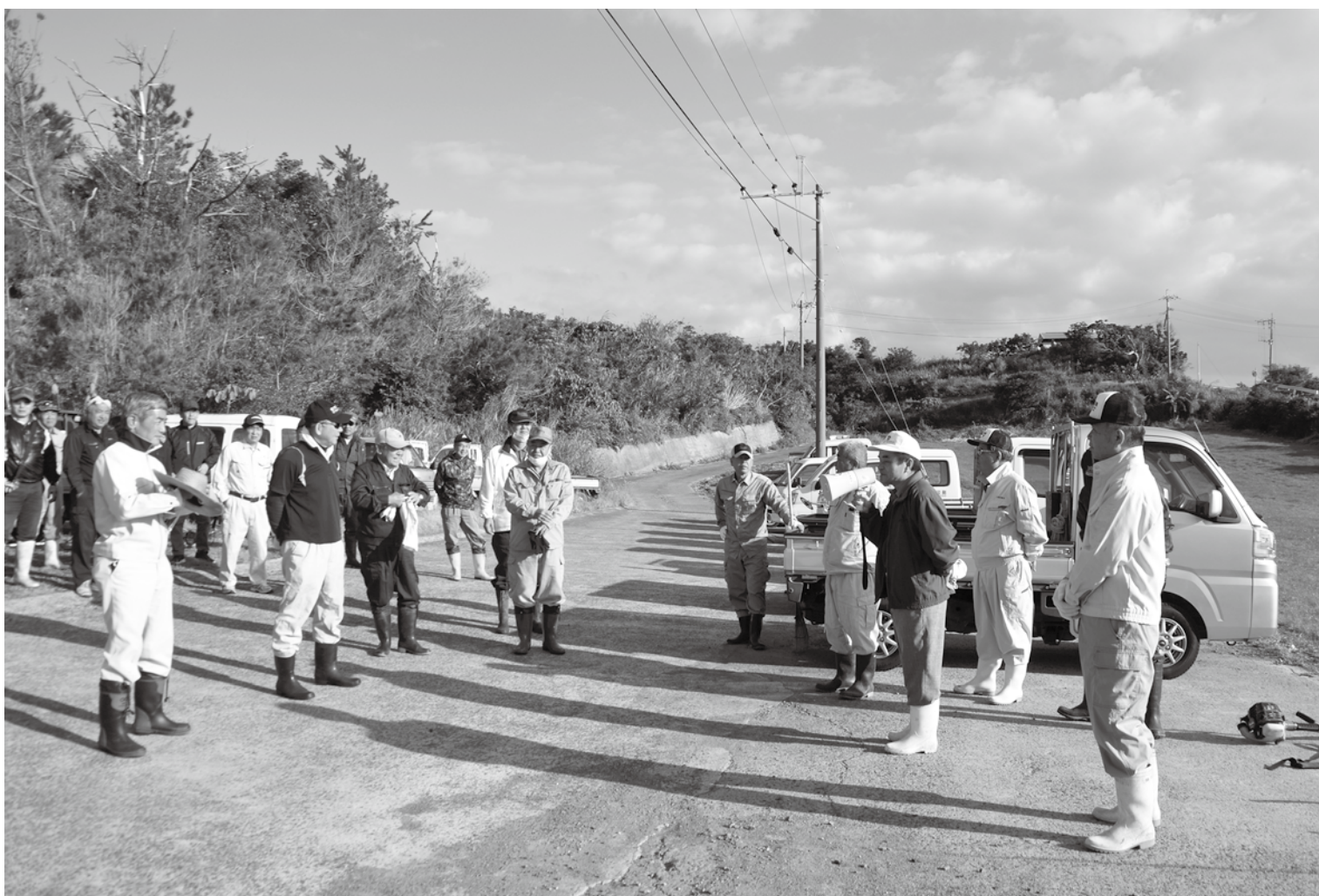
三カ町議会議員連絡協議会による第3回ボランティア清掃（火葬場周辺）

発行：徳之島町議会 編集：議会広報編集委員会 〒 891-7192 鹿児島県大島郡徳之島町亀津 7203 TEL 0997 (82) 1111 FAX 0997 (82) 1101