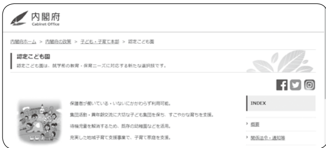
内閣府ホームページの子ども・子育て支援施策