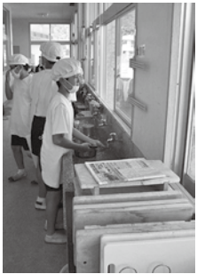
手洗い場で道具を洗う子ども達