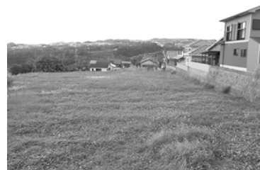
地目変更が待たれる土地

地等の地目変更の転用許可は、農業委員会の承認後、県での書類審査があり、許可に約二、三カ月かかったが、今年度権限移譲を受けたことにより不備がなければ、一カ月ほどで許可書が交付される。