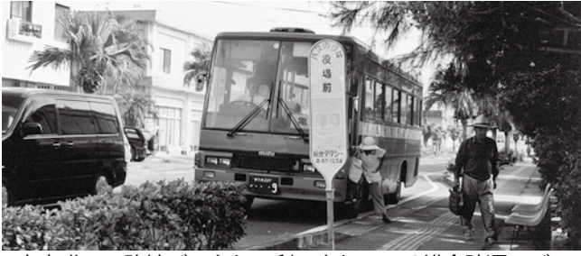
島内唯一の路線バスとして利用されている総合陸運のバス