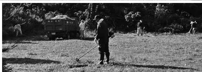
平成 31 年 1 月 24 日 (木)、三カ町議会議員連絡協議会による第 3 回ボランティア清掃で、火葬場周辺の草刈りを実施しました。